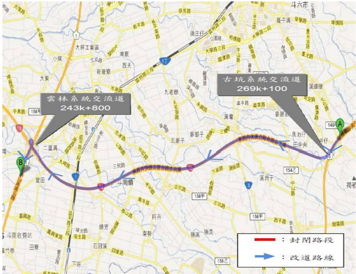
國 3[南向長程]_ 竹崎至中埔交流道長程替代道路示意圖