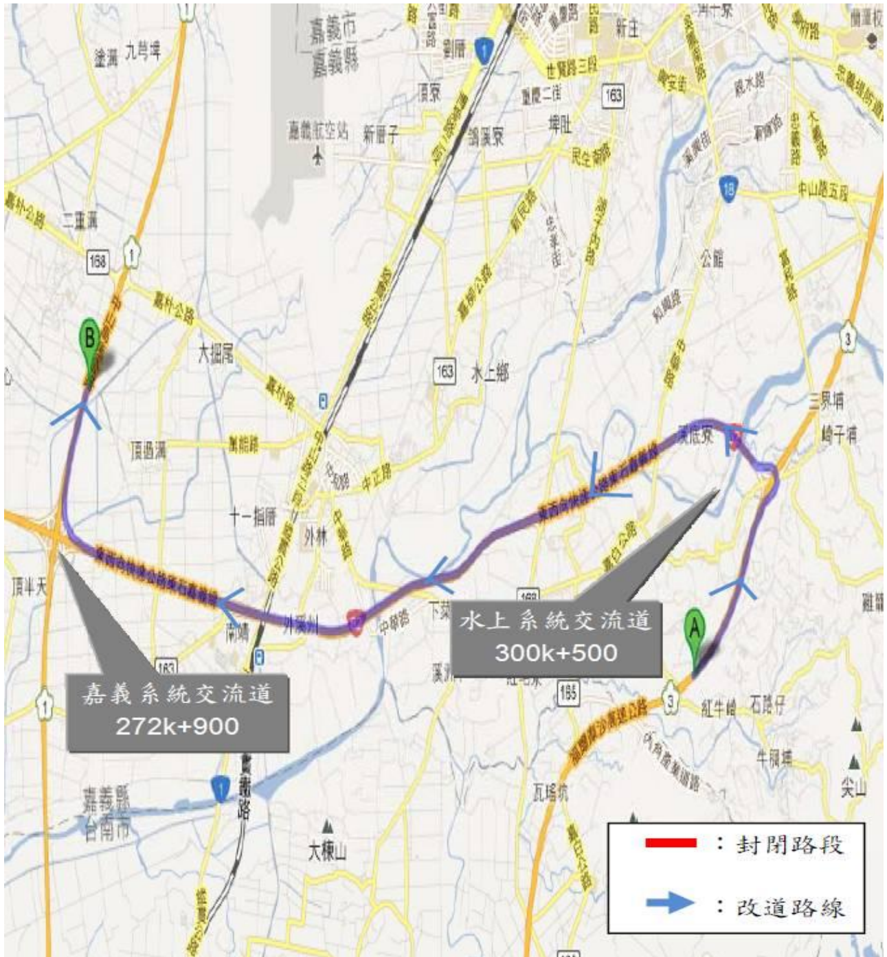
國 3[北向長程]_中埔至竹崎交流道長程替代道路示意圖