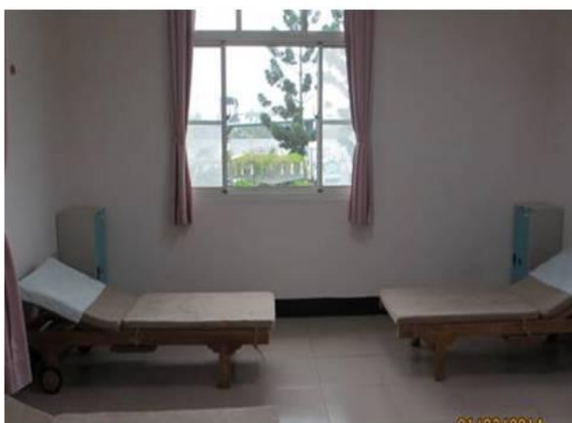
女休息室(提供3張床位)