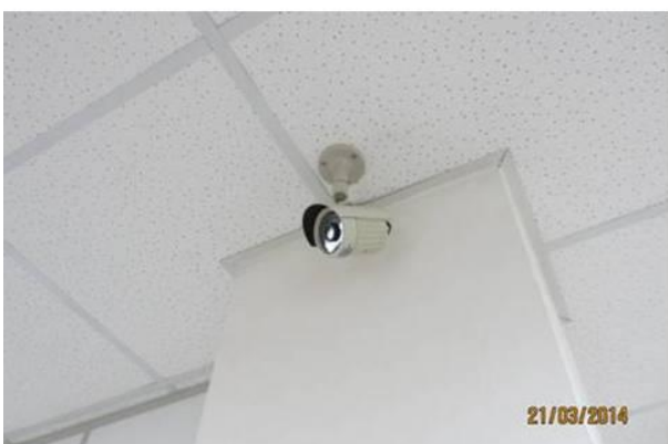
休息室入口監視設施