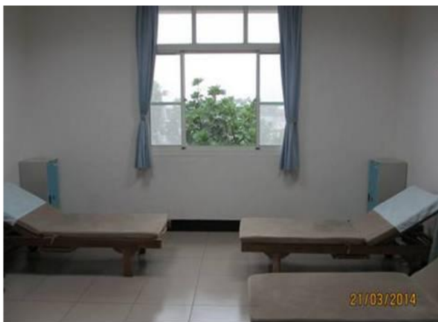
男休息室(提供3張床位)