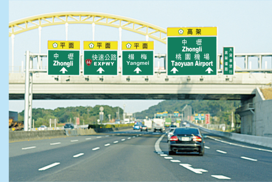
北上過楊梅收費站五楊高架預告