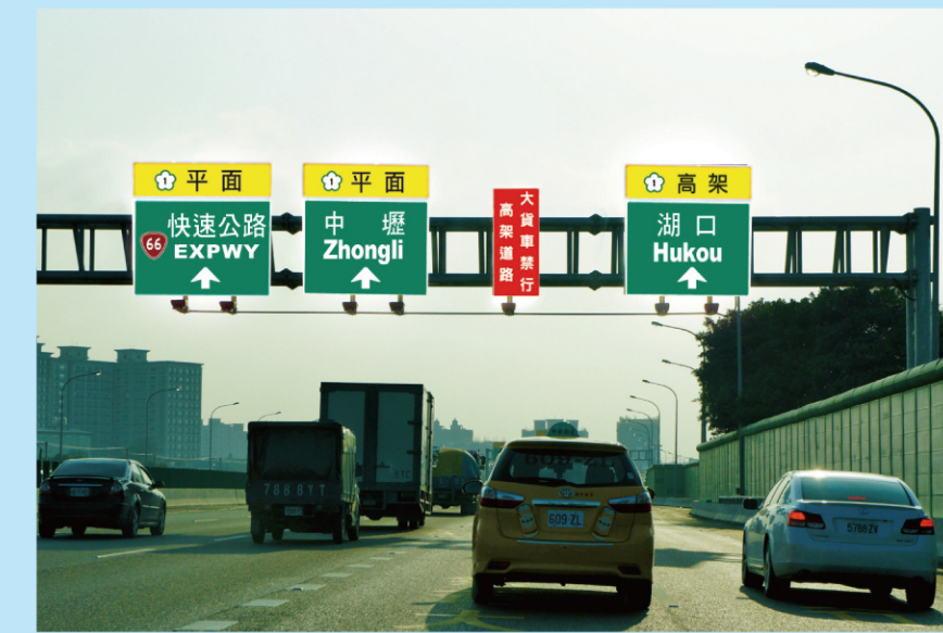
南下中壢轉接道預告