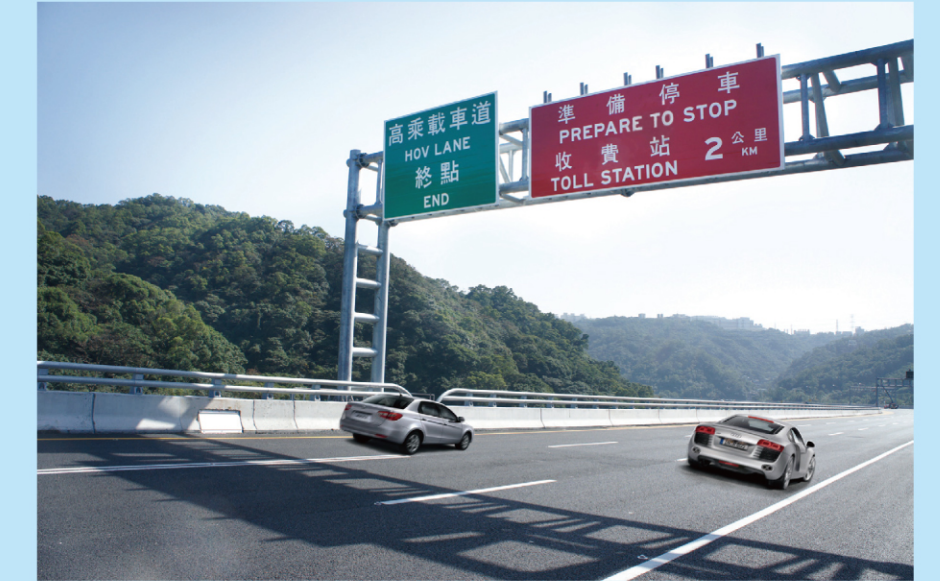
高架北上泰山收費站預告