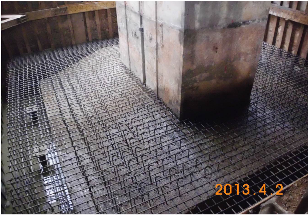
龍潭高架橋P13S鋼筋綁紮作業