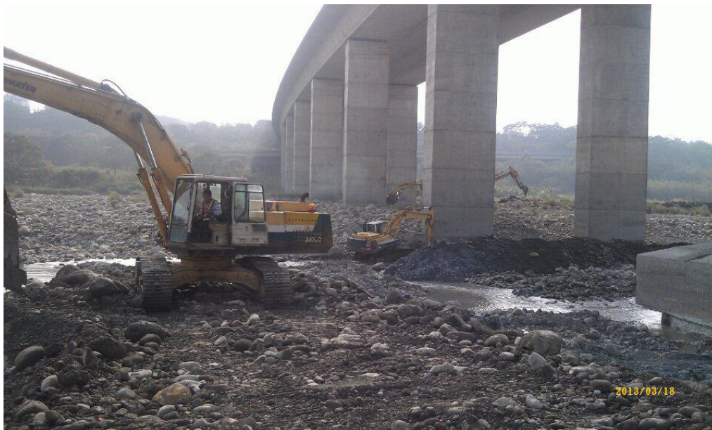
中和交流道匝道A施工完成現況