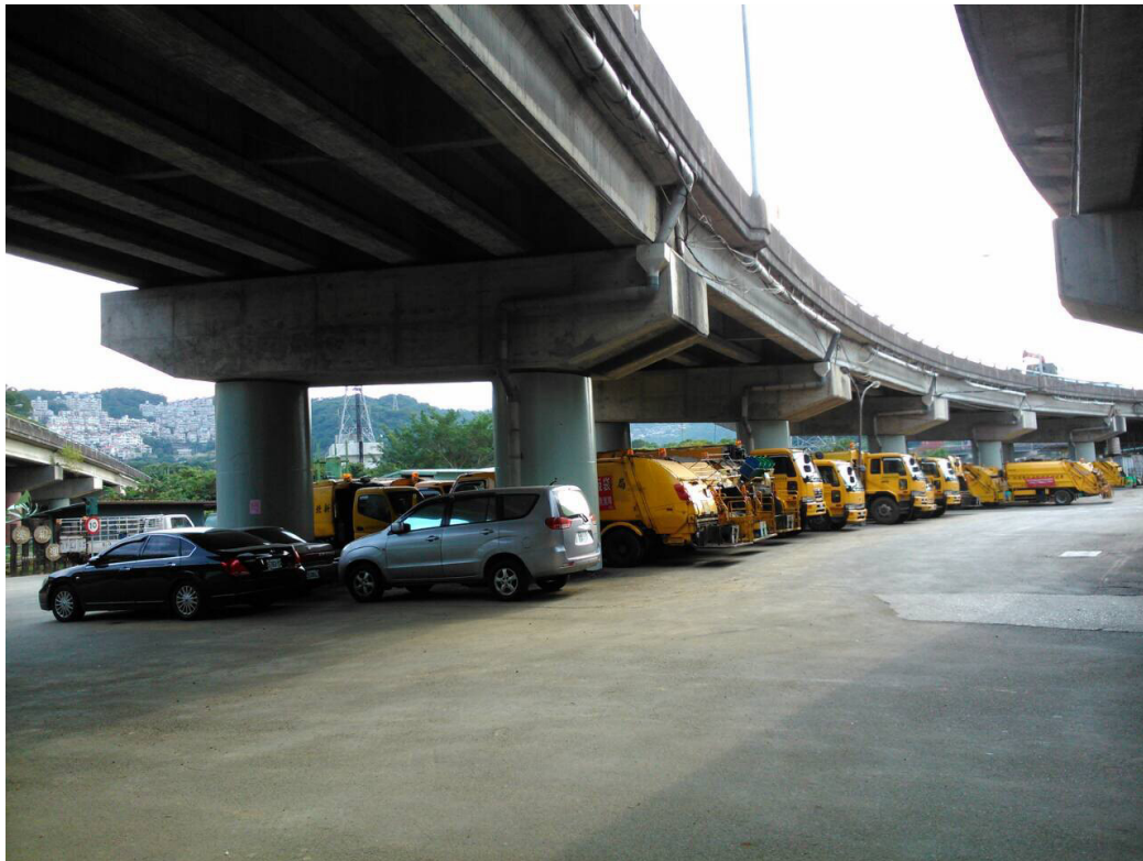
中和交流道匝道A施工完成現況