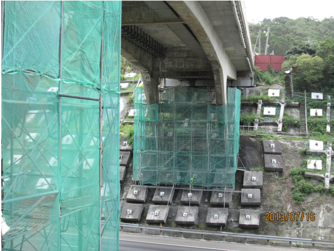
龍潭高架橋P13S鋼筋綁紮作業