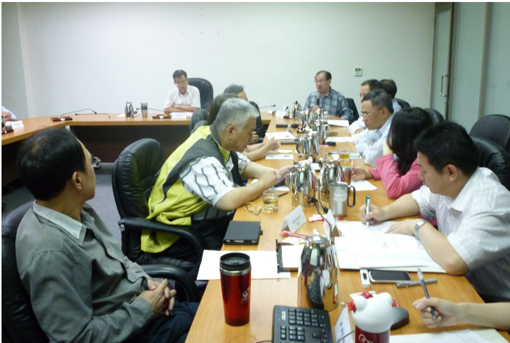
圖(一)本處103年第1次廉政會報召開情形

分別於103年5月21日、103年10月6日召開，會議討論按本處業務實際狀況計提案4案、2件報告案及加強宣導「行政院暨所屬機關機構請託關說登錄查察作業要點」、「公務員廉政倫理規範(受贈財物)」廉政法規，主席裁(指)示事項簽奉處長核示，函本處各單位據以執行。