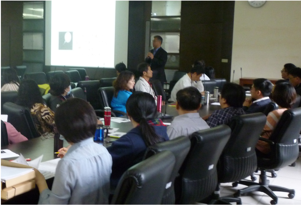
圖(八)103年公務機密維護宣導講習

為避免同仁不慎洩漏公務上知悉秘密，本室於103年5月5日辦理「公務機密維護」宣導講習。