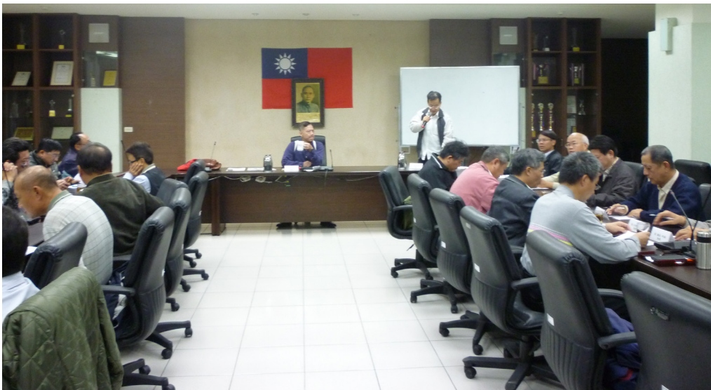
圖(五)本處推動企業誠信廠商座談會

為宣導企業誠信及企業倫理觀念，協助企業建立倫理規範及公司治理，爭取企業主的支持與配合，本室於103年11月18日辦理「推動企業誠信」廠商座談會，邀請國立空中大學副教授沈中元蒞處演講，共同主持座談會。