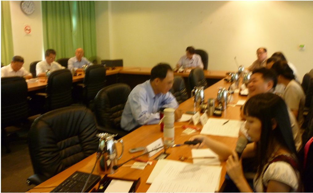
圖(二)本處103年第2次廉政會報召開情形