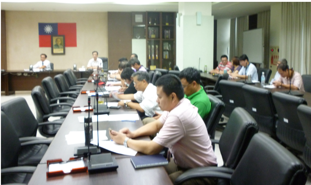
圖(三)主管人員法紀宣導講習

為確保公務員清廉自持、公正無私、依法執行職務，強化本處同仁廉政法治觀念，本室分別於103年10月1日辦理主管人員法紀宣導、103年10月14日辦理公務員廉政倫理規範宣導講習，並持續透過多元管道宣導，有效落實執行請託關說、飲宴應酬、贈受財物等事件之報備登錄。