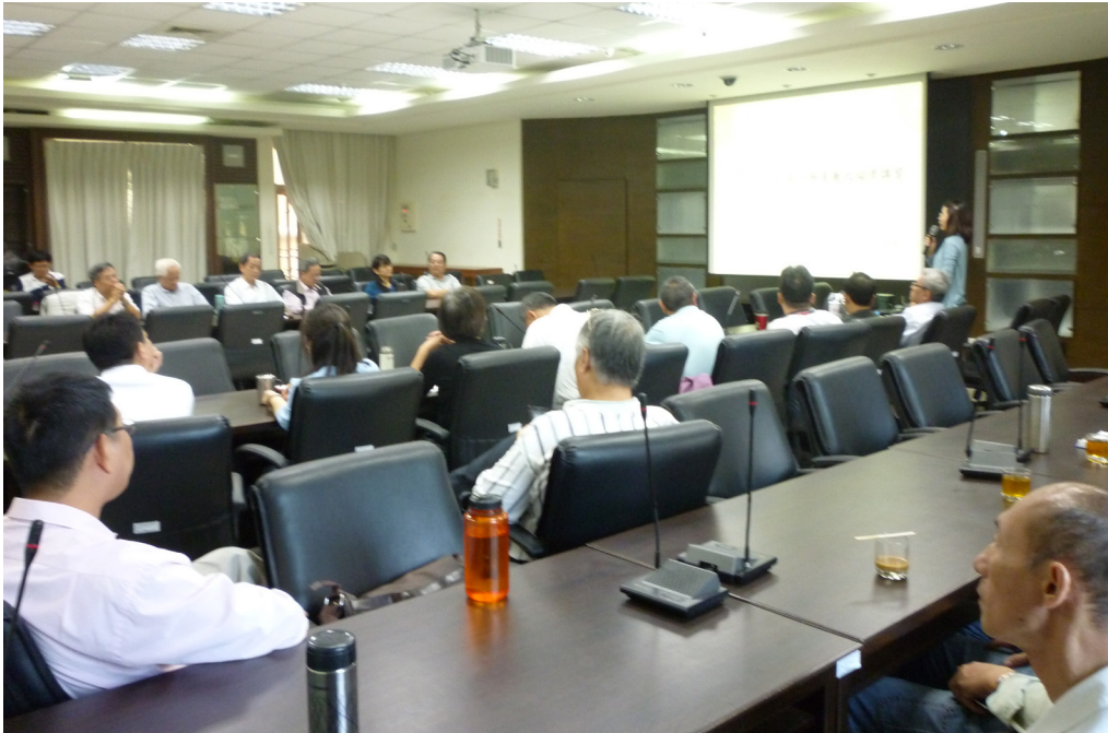
圖(四)公務員廉政倫理宣導講習