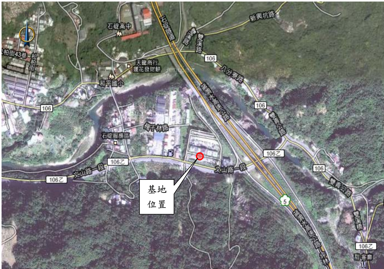
圖 2.1-2 基地空照圖