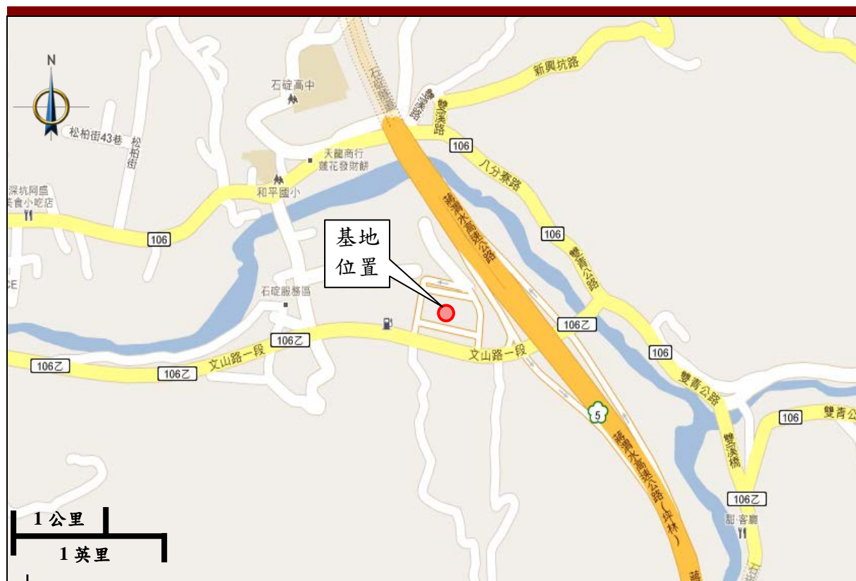
圖 2.1-1 基地位置圖

本計畫區坐落於北宜高速公路石碇交流道旁，為台北與宜蘭聯絡道路之重要樞紐，基地面積約為 2.3 公頃，主要聯外道路為台 106 乙道路（文山路一段），往東與深坑相鄰，往西聯連接國道 5 號，基地之位置及範圍如圖 2.1-1 所示，空照圖詳見圖 2.1-2。