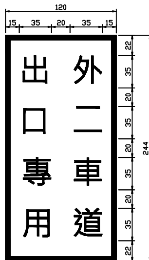
外二車道出口專用標誌尺寸詳圖 (B-B-Y)