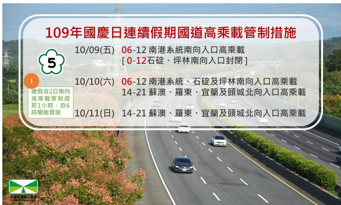
圖 2 109 年國慶日連續假期國道高乘載疏運措施