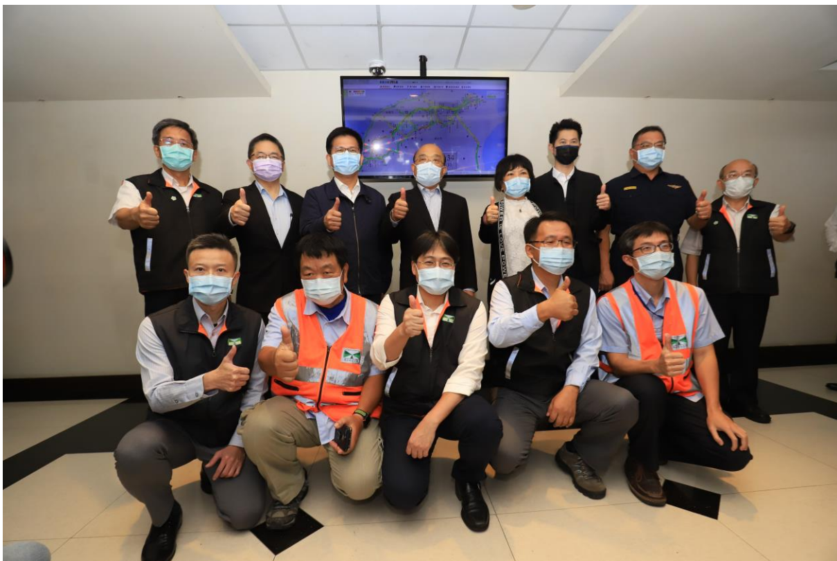
圖 2 院長、部長視察交通部高速公路局