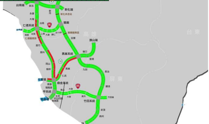
中秋節連假首日南部路段南向路況預報圖