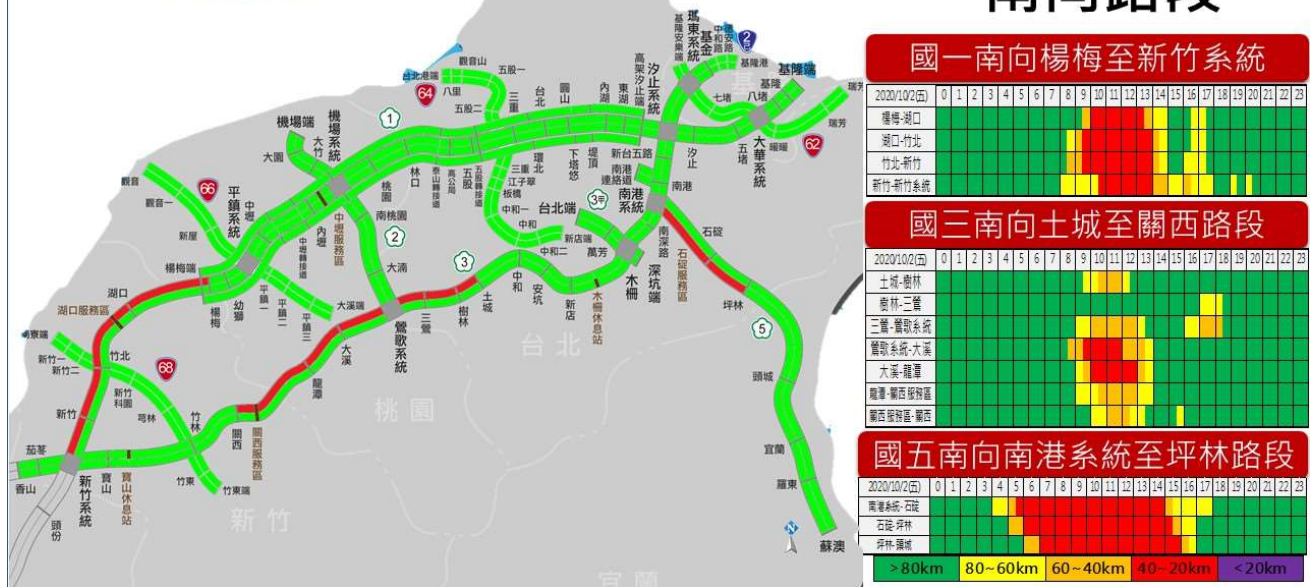
圖 3-中秋節第 2 日北部路段南向路況預報圖