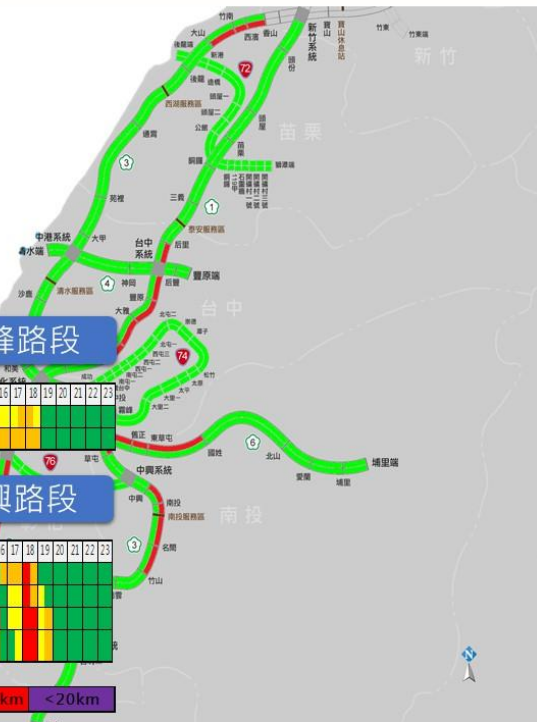
國慶第2日中部路段北向路況預報圖