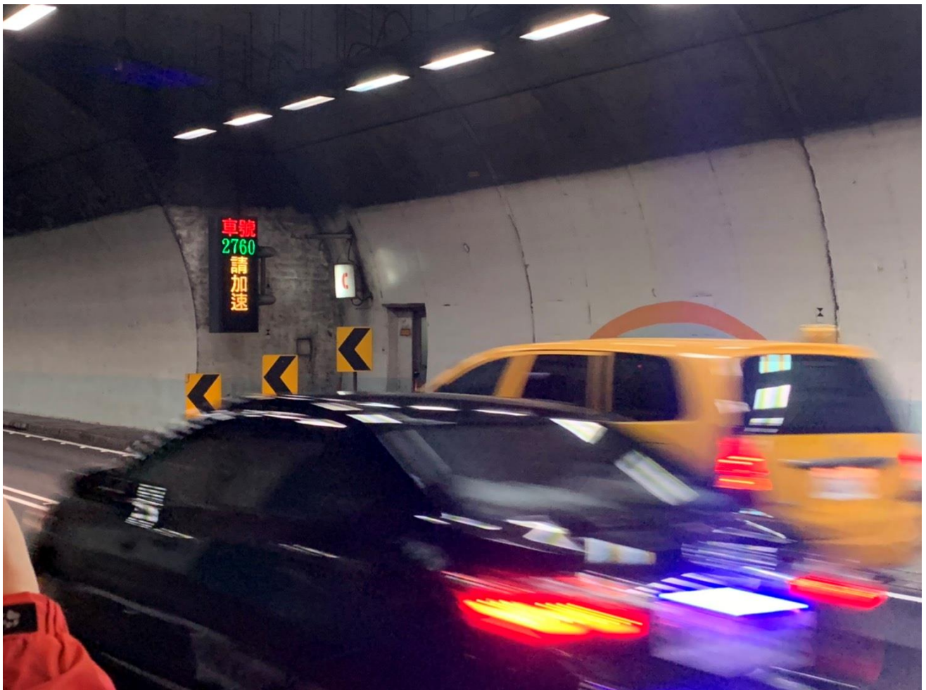
附圖 2：CMS 顯示慢速車車號