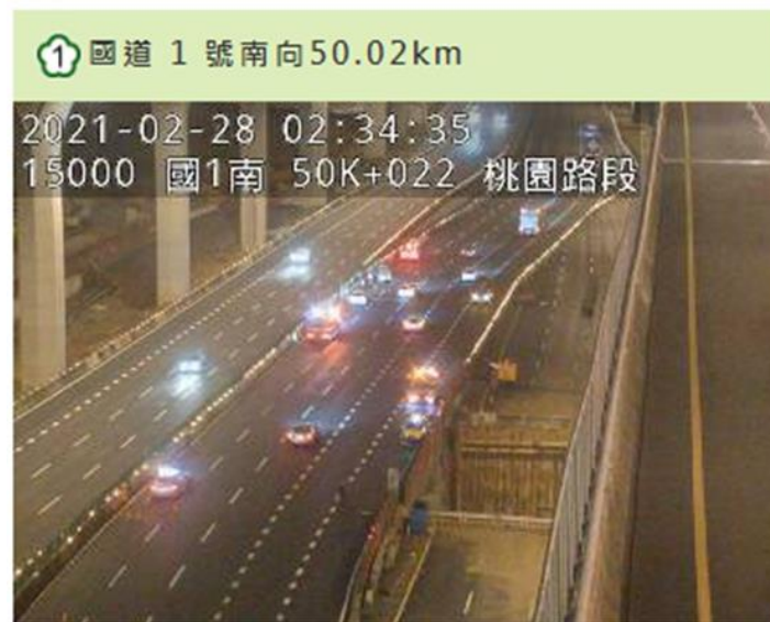
附圖 1 國 1 南向 50.4K 內側 2 小車及外側 1 小車翻覆之追撞事故