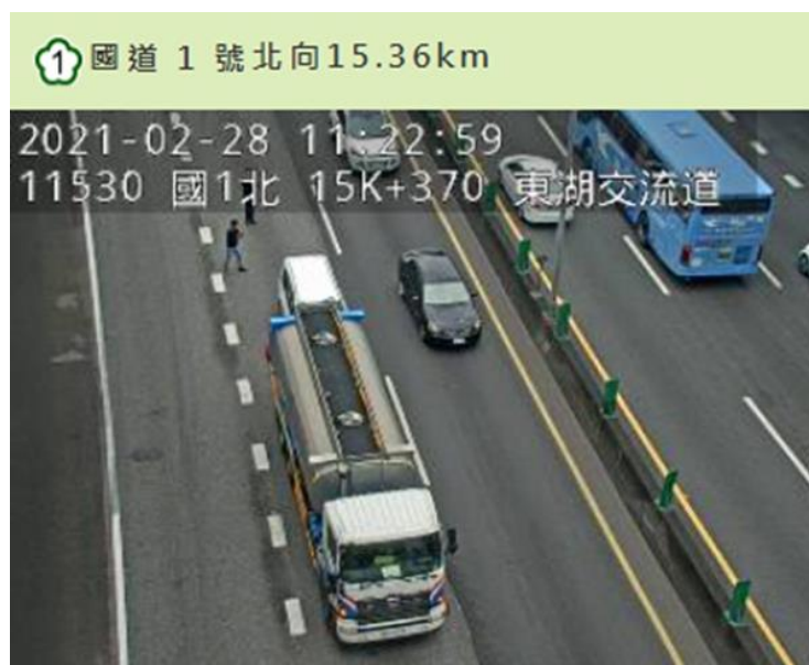
附圖 2 國 1 北向 15.4K 發生 1 槽車及 1 小車追撞