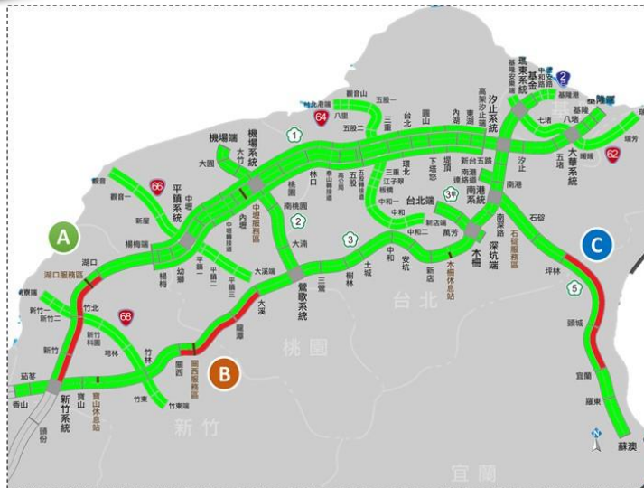
和平第2日南部路段南向路況預報圖