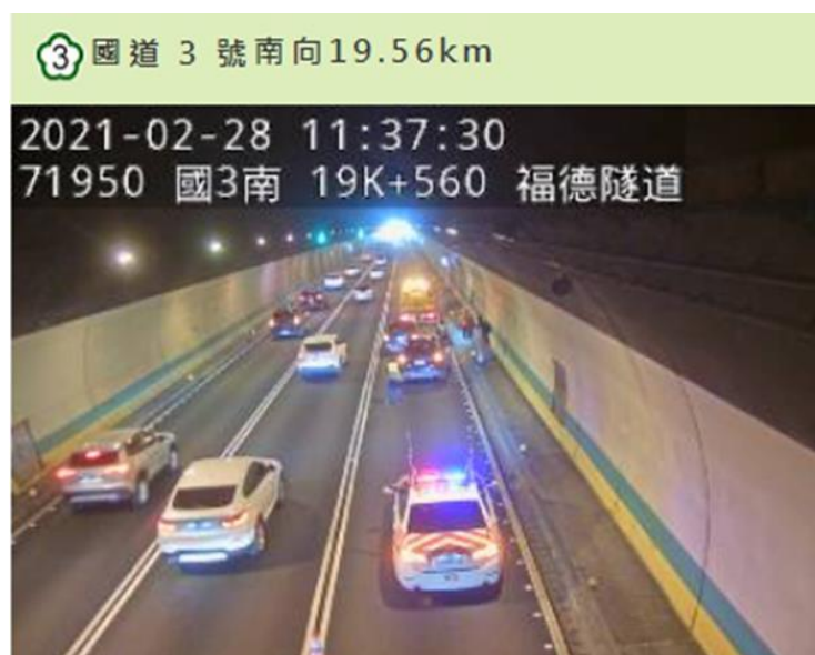
附圖 3 國 3 南向 19.6 公里外線 2 小客車追撞事故