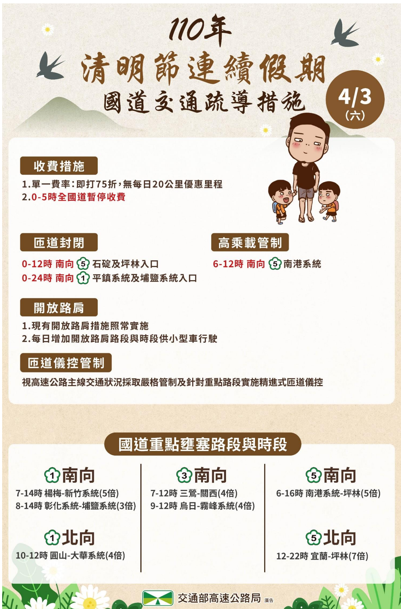
附圖 5：110 年清明連假第 2 日國道疏導措施