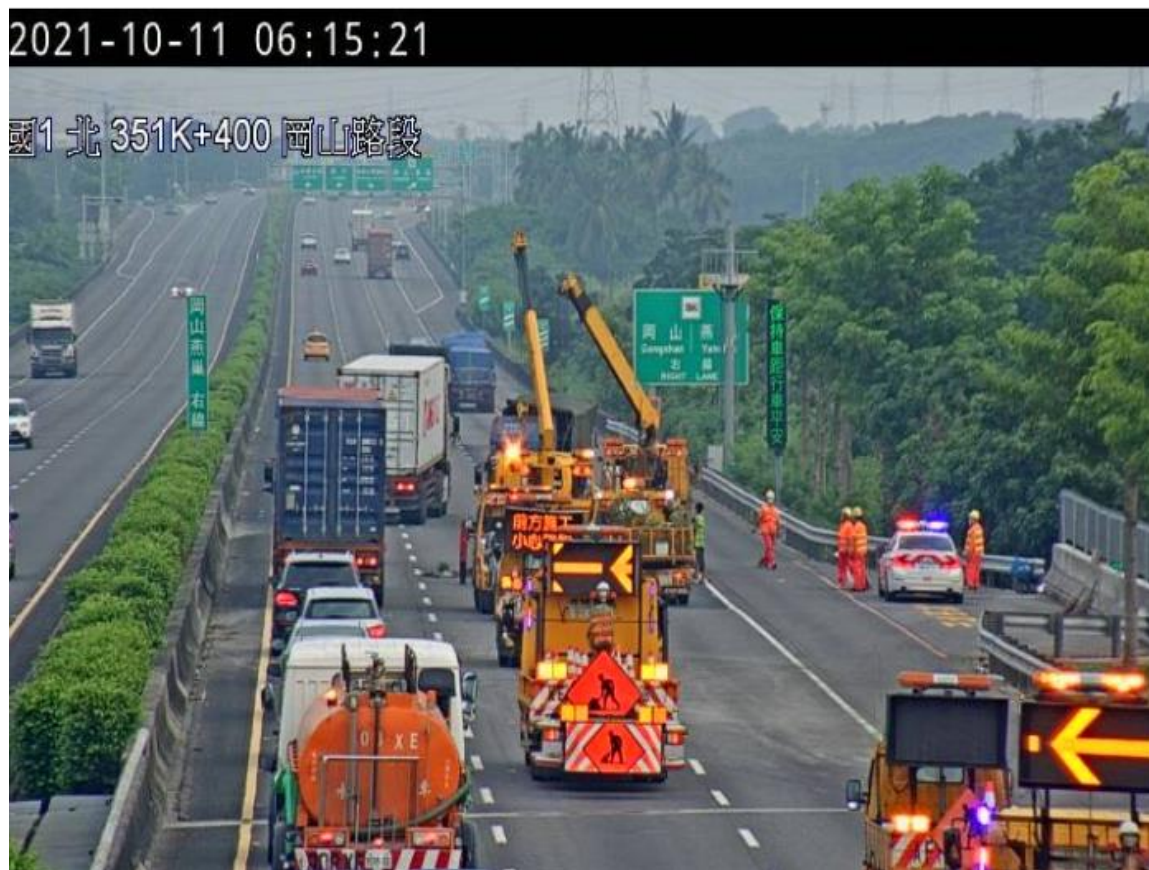
附圖 2：國 1 南向 20.6 公里處發生 1 輛小客車與小貨車追撞事故