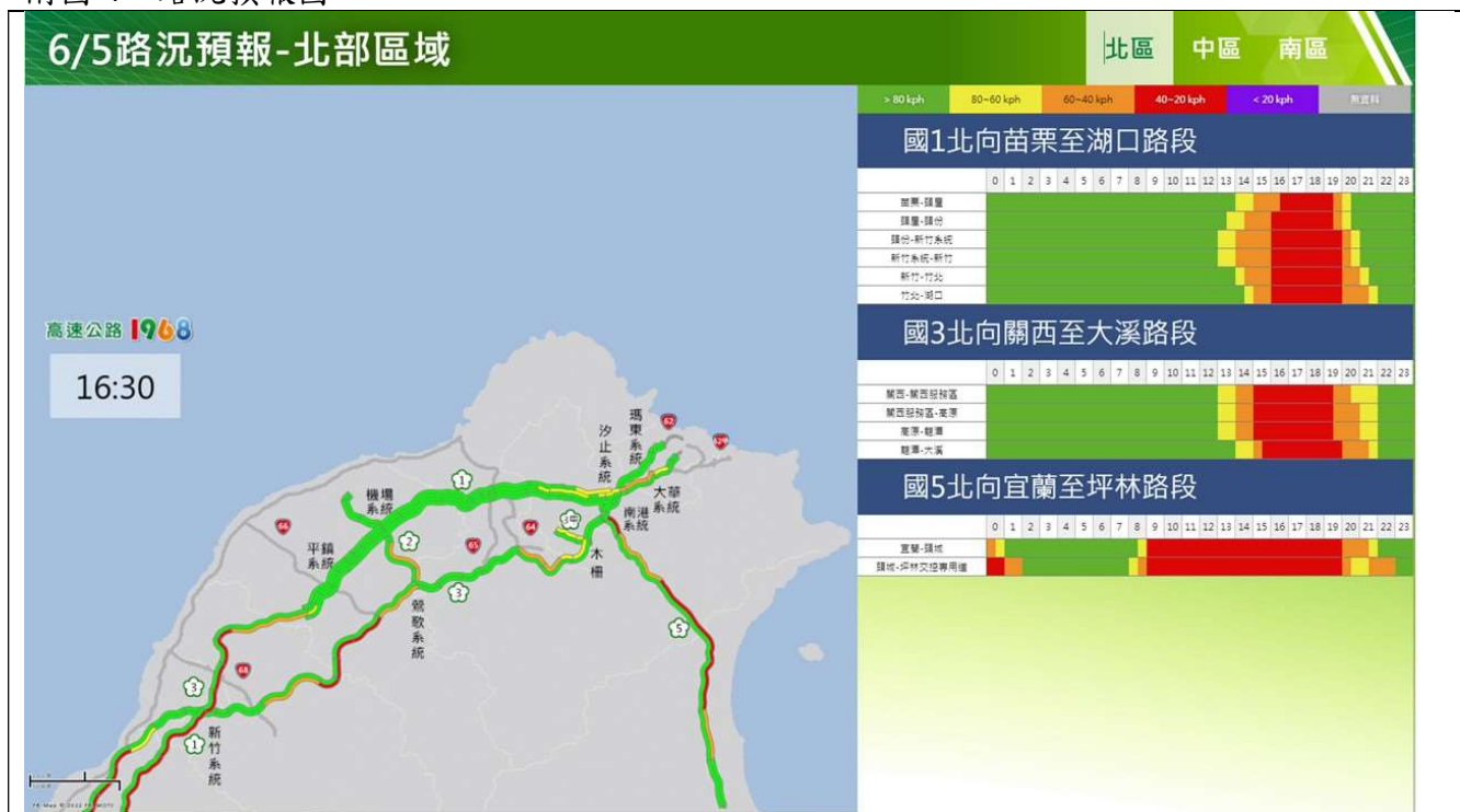
端午節連假收假日北部路段北向路況預報圖