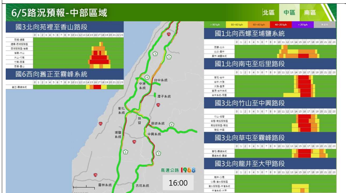
端午節連假收假日中部路段北向路況預報圖