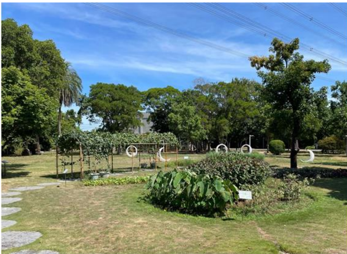
圖5 中壢服務區—可食地景公園