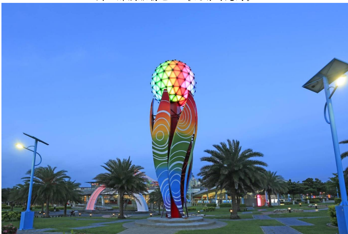
圖2 清水服務區—《清水夜明珠》