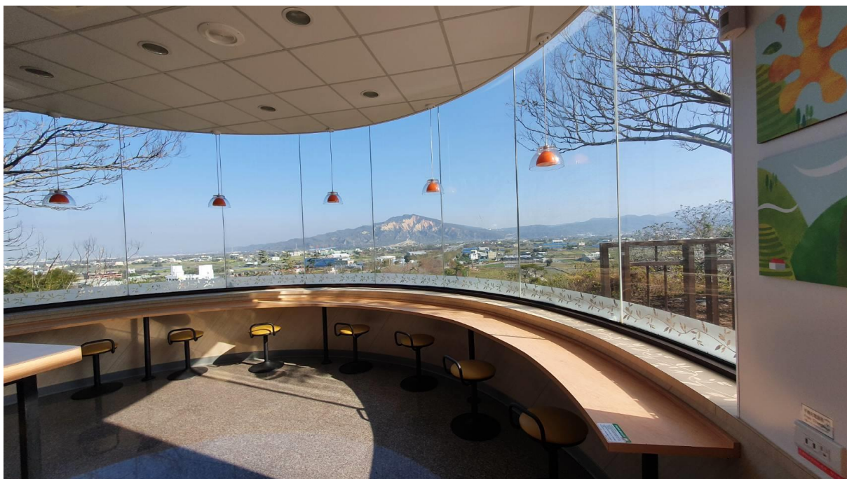
圖3 泰安服務區(北站) —眺望火炎山