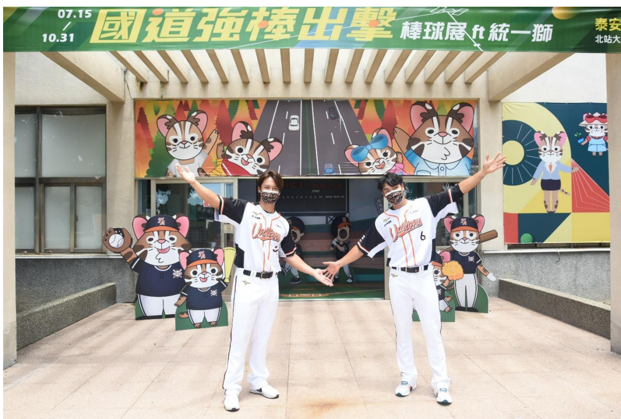
圖4 泰安服務區(北站)—國道強棒出擊棒球展