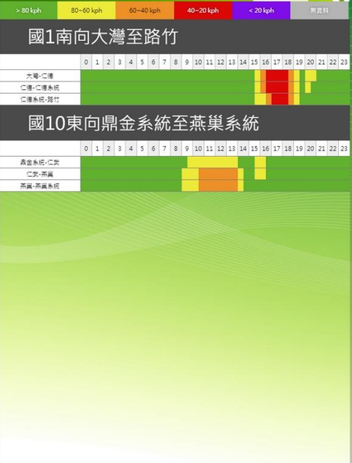
中秋節連假第 2 日南部路段南向路況預報圖