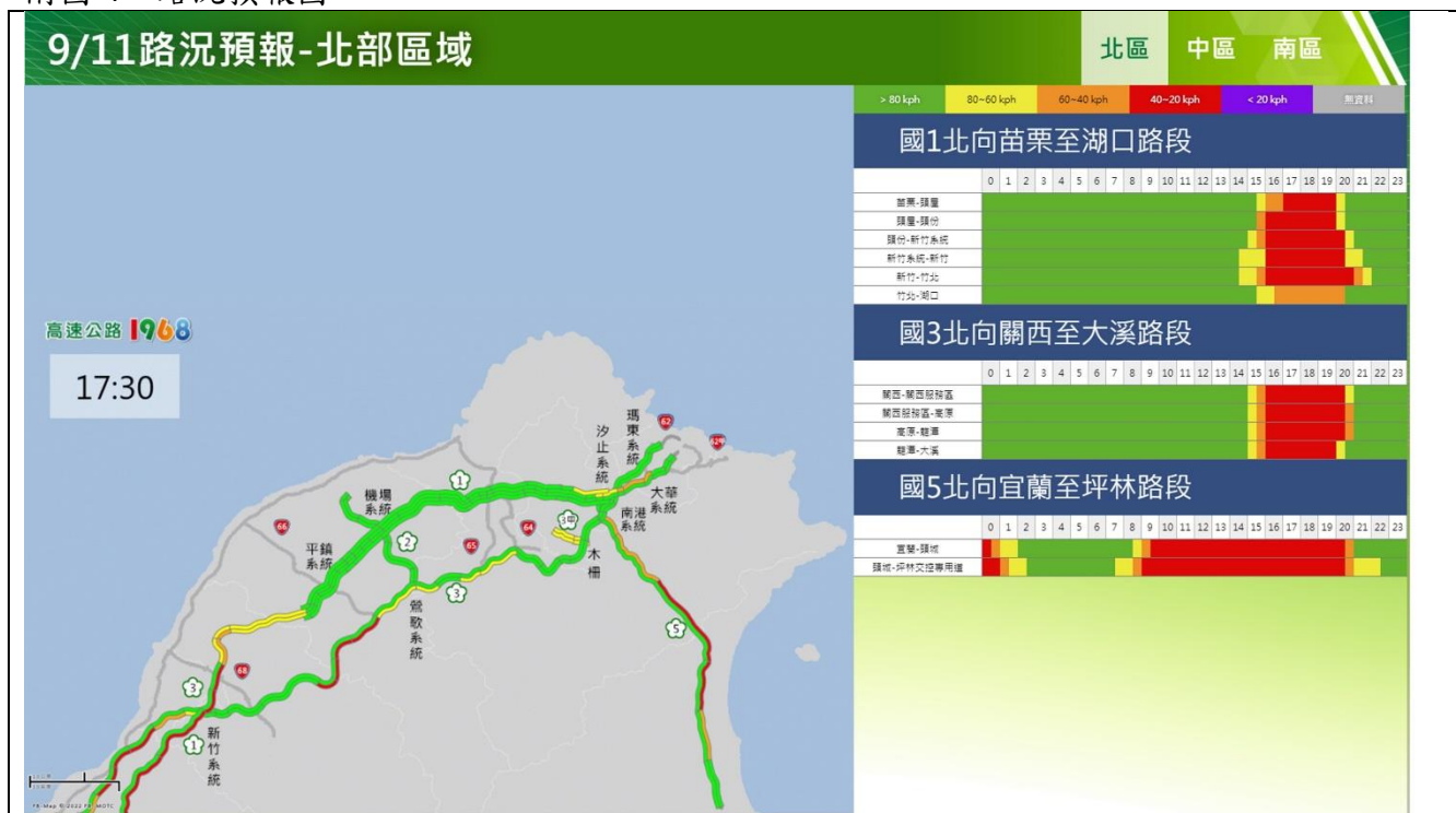
中秋節連假收假日北部路段北向路況預報圖