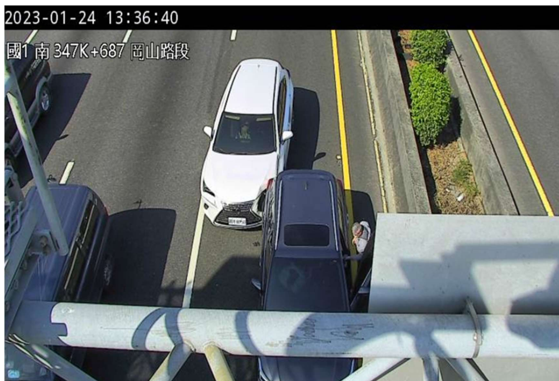
附圖 2 國 1 南向 291.5 公里處發生 2 輛小客車追撞事故，造成後方車流回堵 3 公里