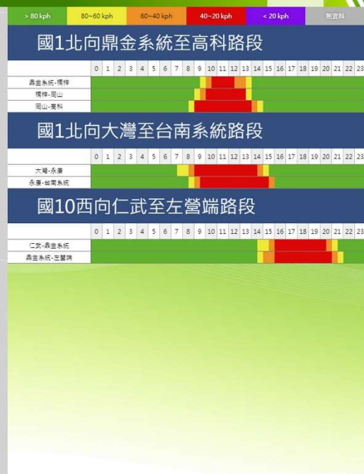
春節連假初四南部路段北向路況預報圖