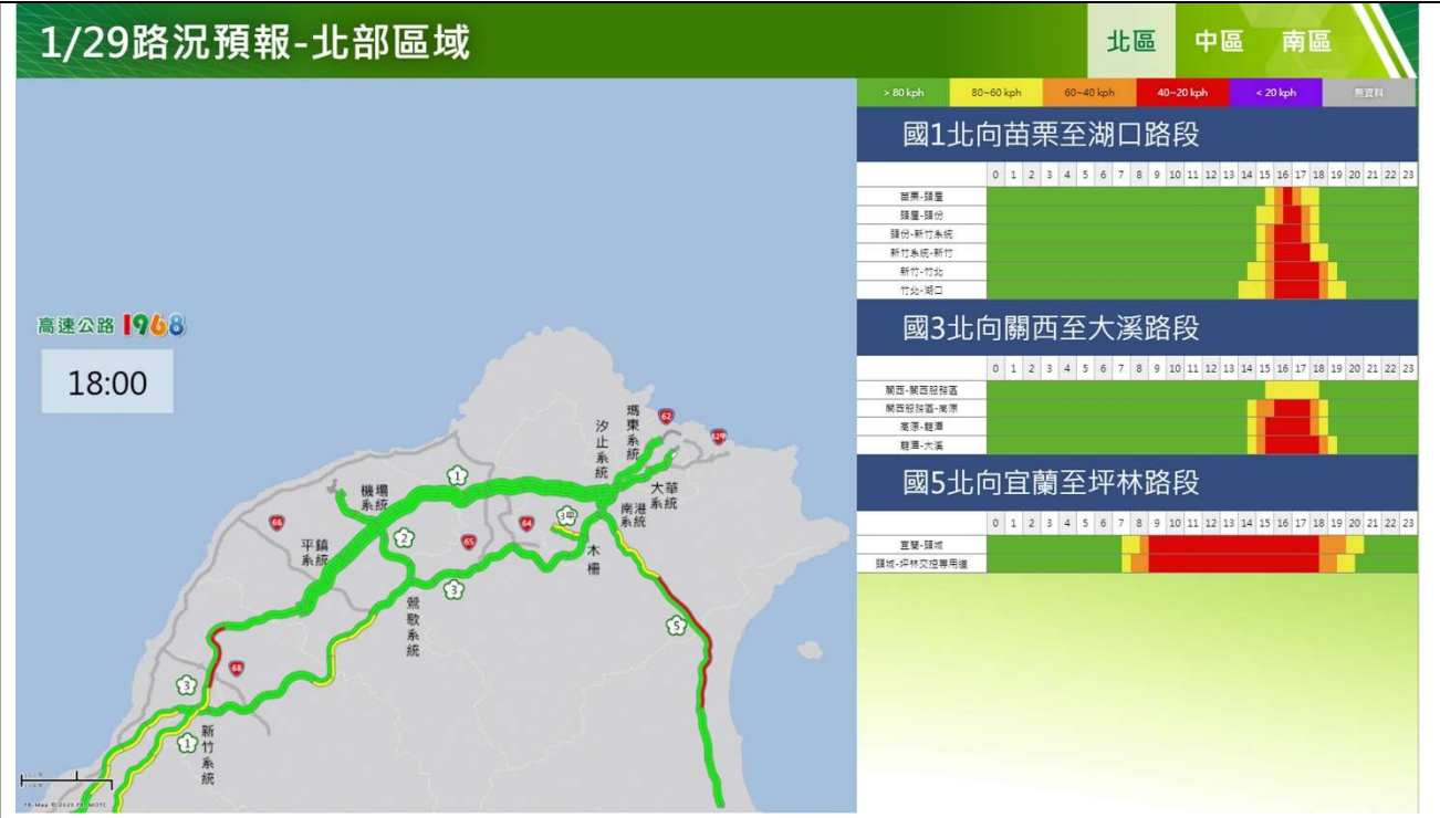
春節連假初八北部路段北向路況預報圖