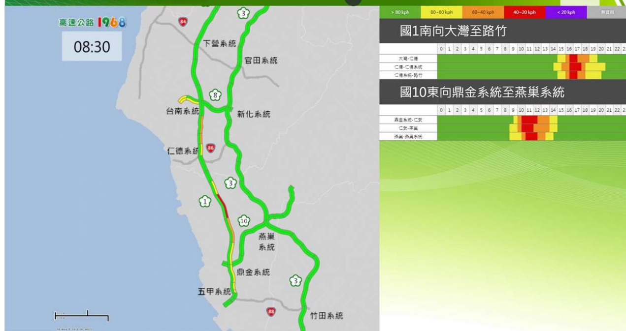
和平連假第2日南部路段南向路況預報圖