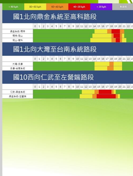
和平連假第3日南部路段北向路況預報圖