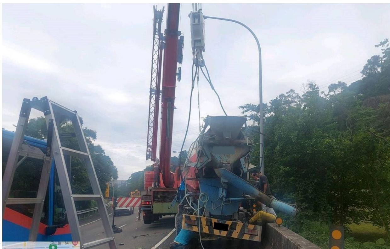
圖 4：6/12 國 3 北中和出口水泥車自撞翻覆