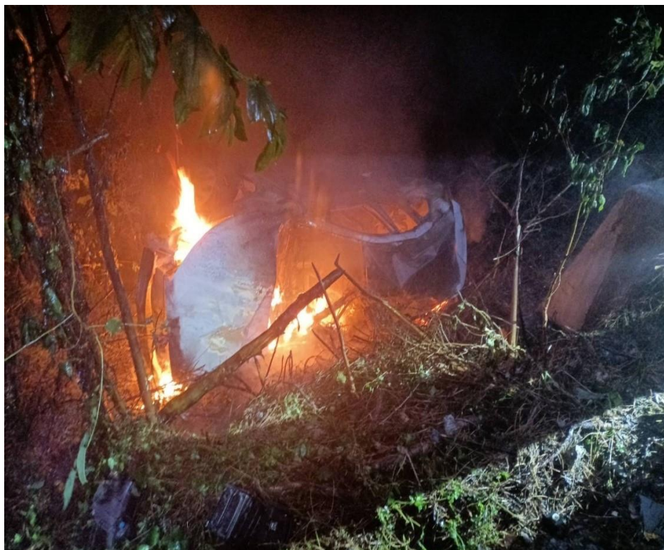
圖 3：5/19 國 3 南 87.1k 小客車自撞