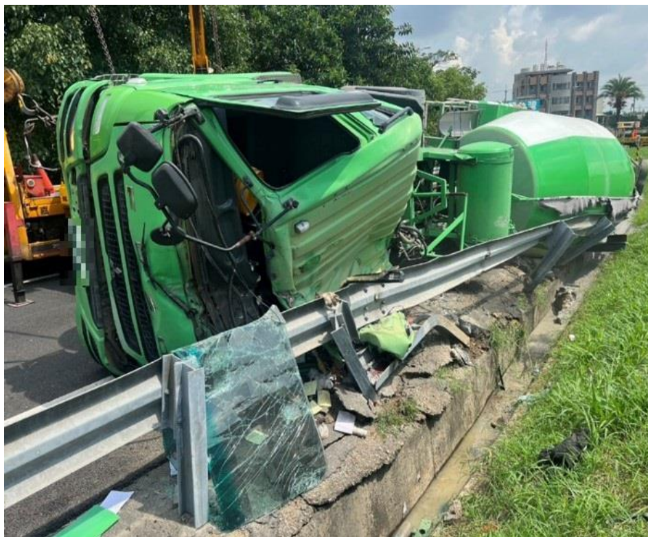
圖 5：6/19 國 1 南新營入口水泥車自撞翻覆