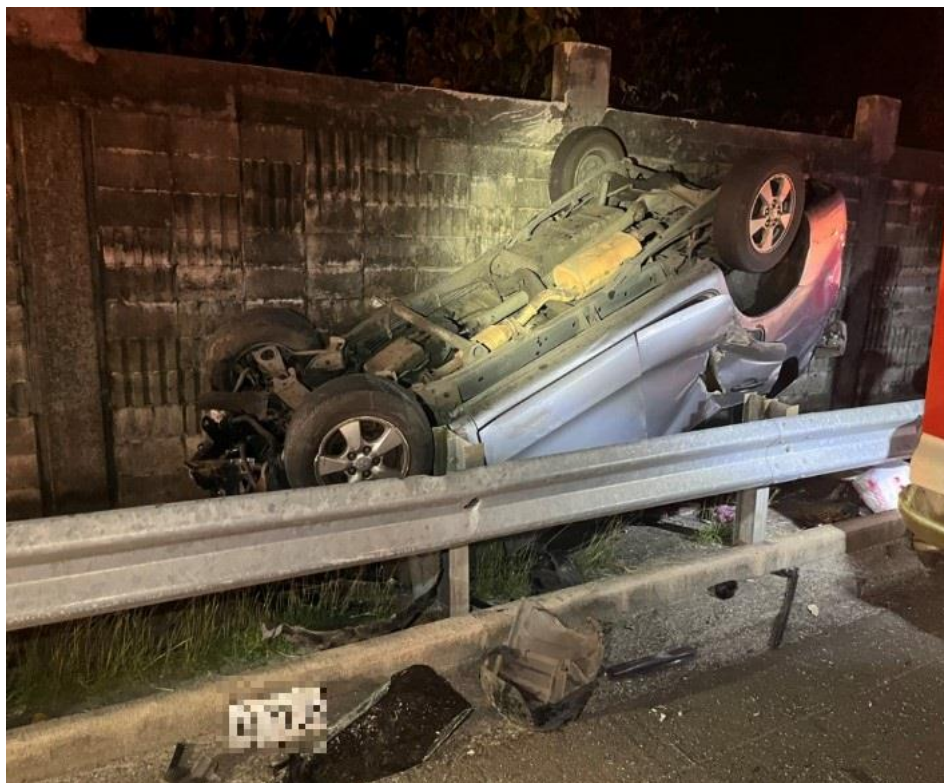
圖 1：2/13 國 3 北 305.5k 小客車自撞