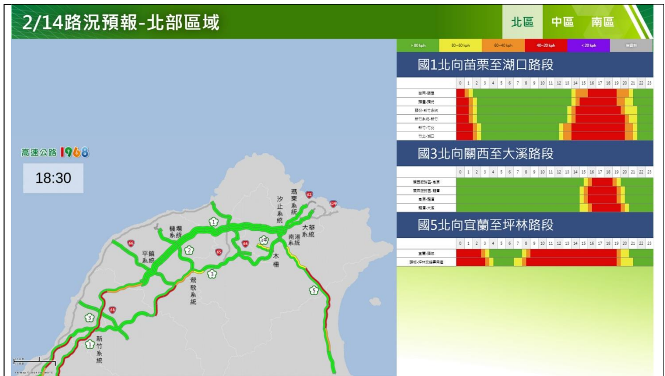
春節連假初五北部路段北向路況預報圖