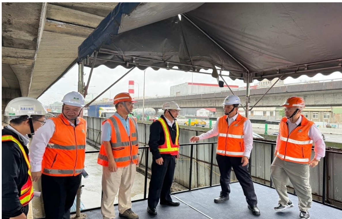
圖 1 交通部陳政務次長視察工程