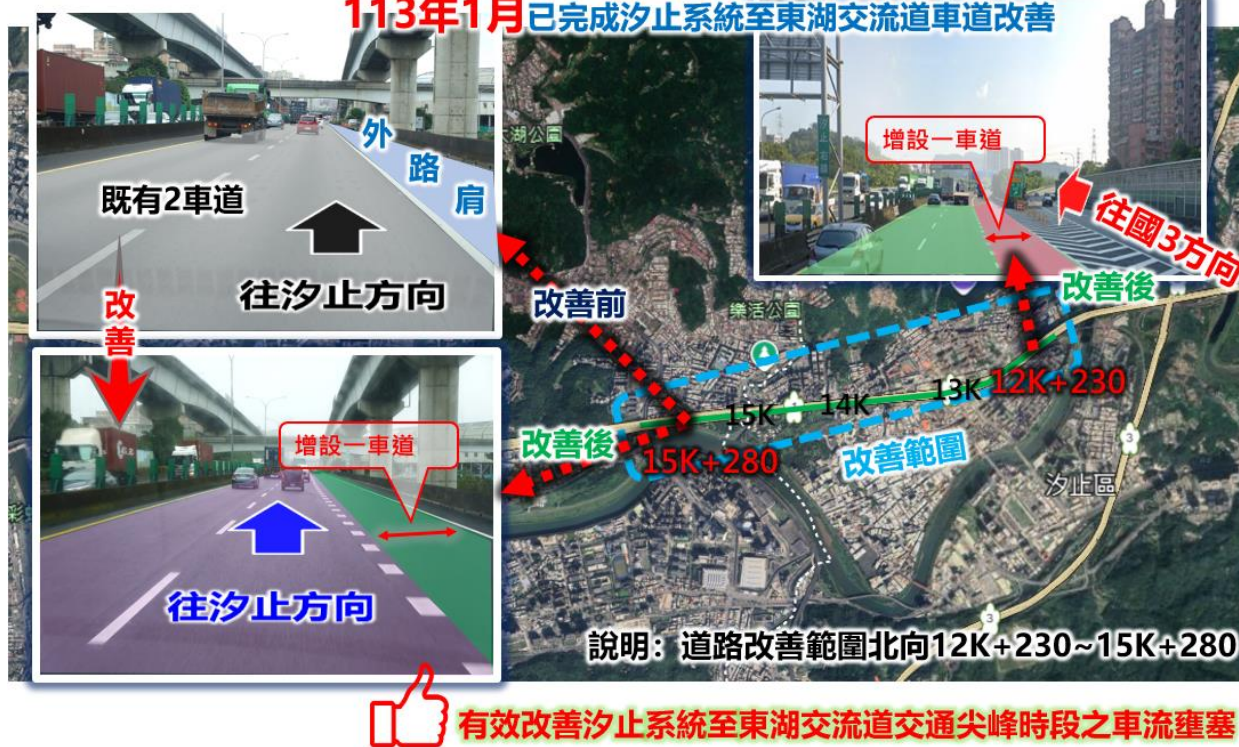
圖 4 國道 1 號北向汐止系統至東湖交流道車道改善工程