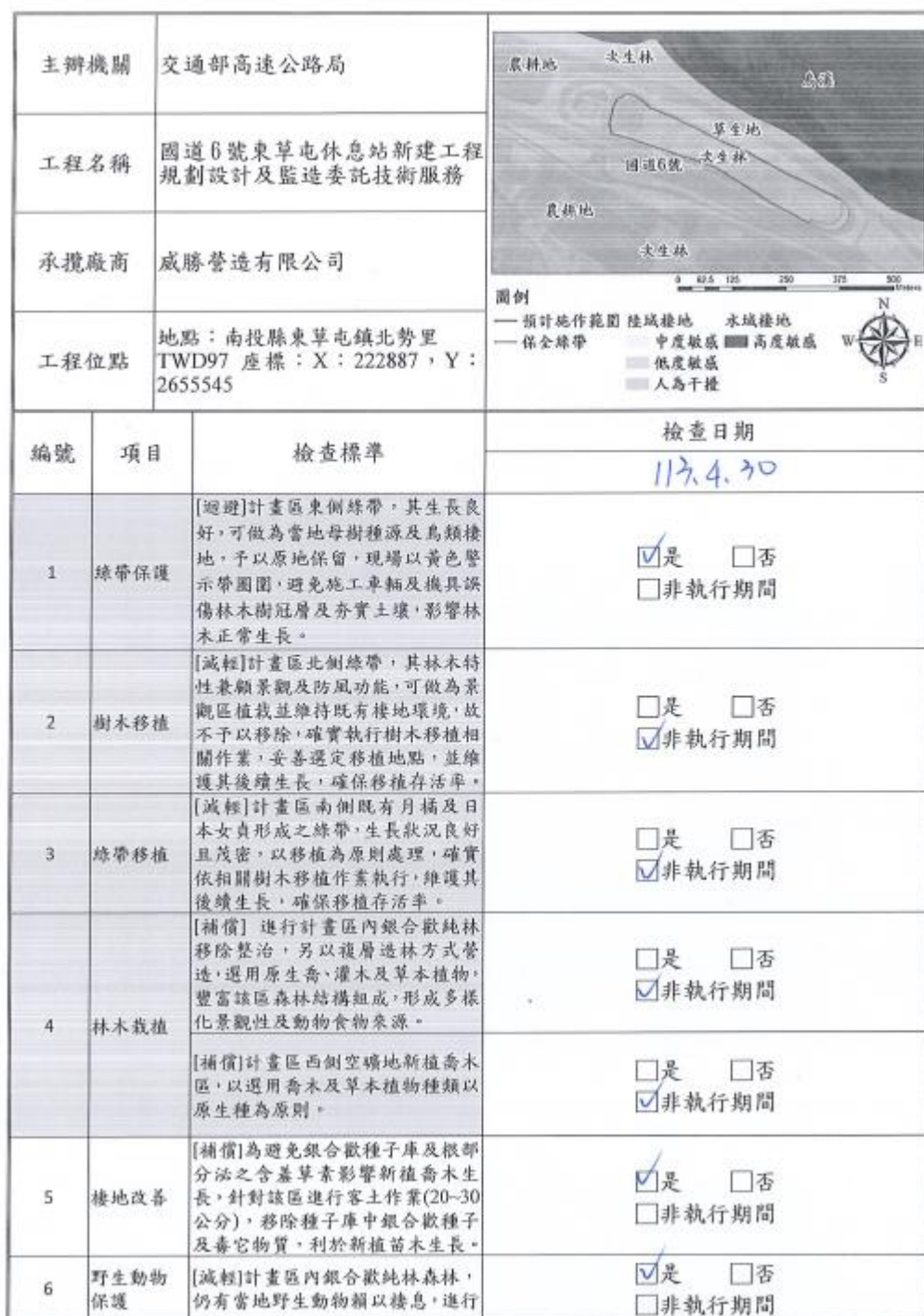
附表 6 生態保育措施-檢核表(施工階段填寫)