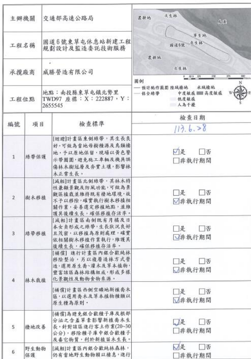
附表 6 生態保育措施-檢核表(施工階段填寫)