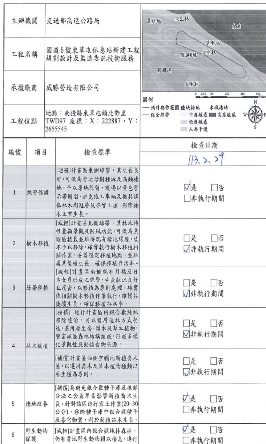
附表 6 生態保育措施-檢核表(施工階段填寫)