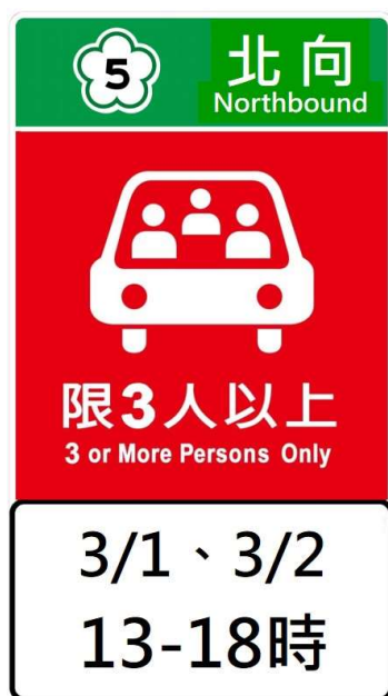
附圖 2 紅底白字文字型禁制性告示牌