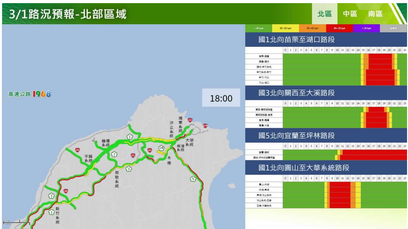
附圖 8：和平紀念日連假第 2 日路況預測(北區北向)