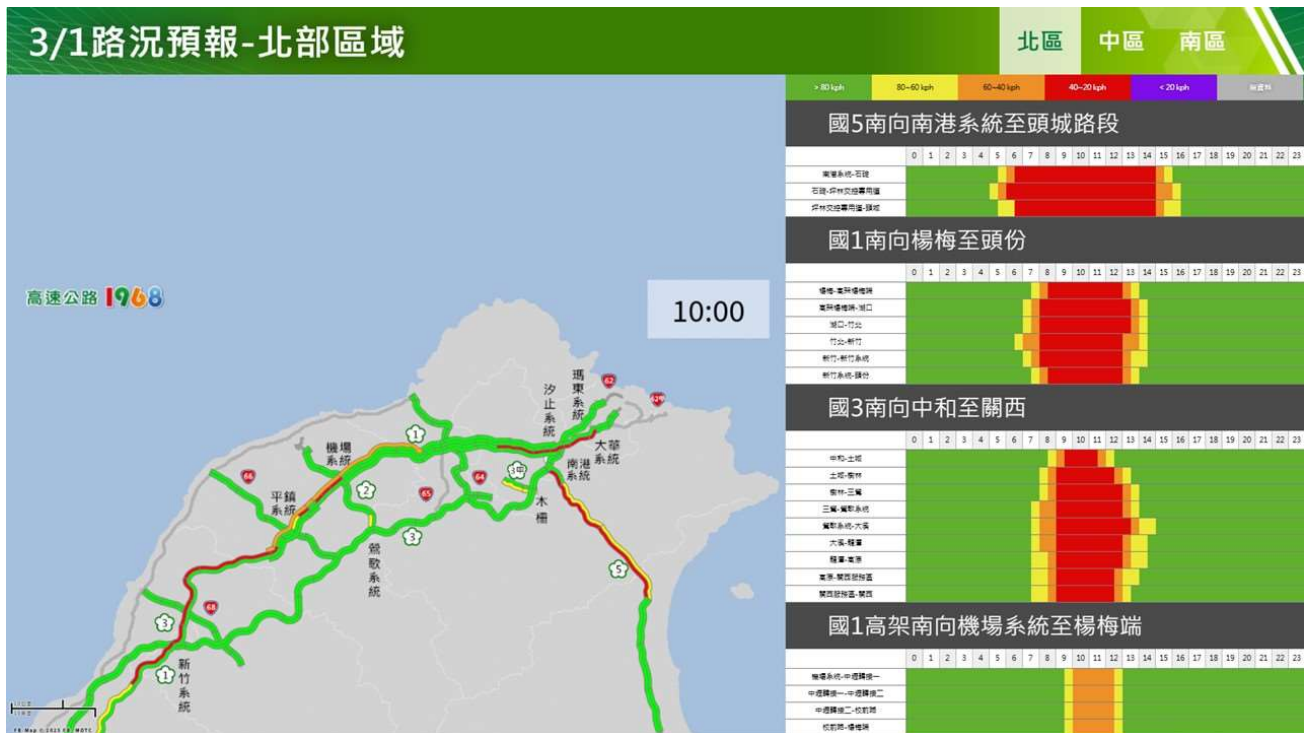
附圖 7：和平紀念日連假第 2 日路況預測(北區南向)