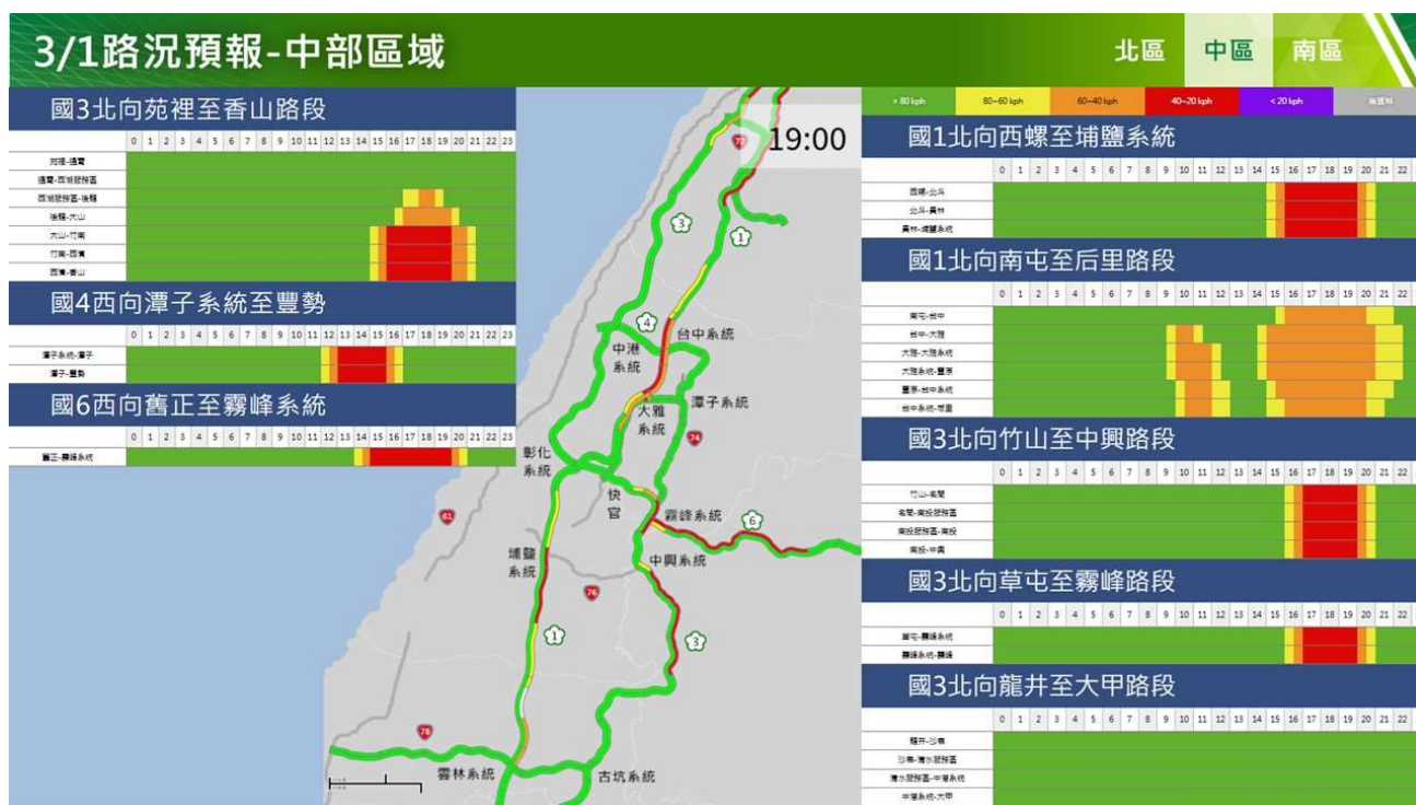
附圖 10：和平紀念日連假第 2 日路況預測(中區北向)