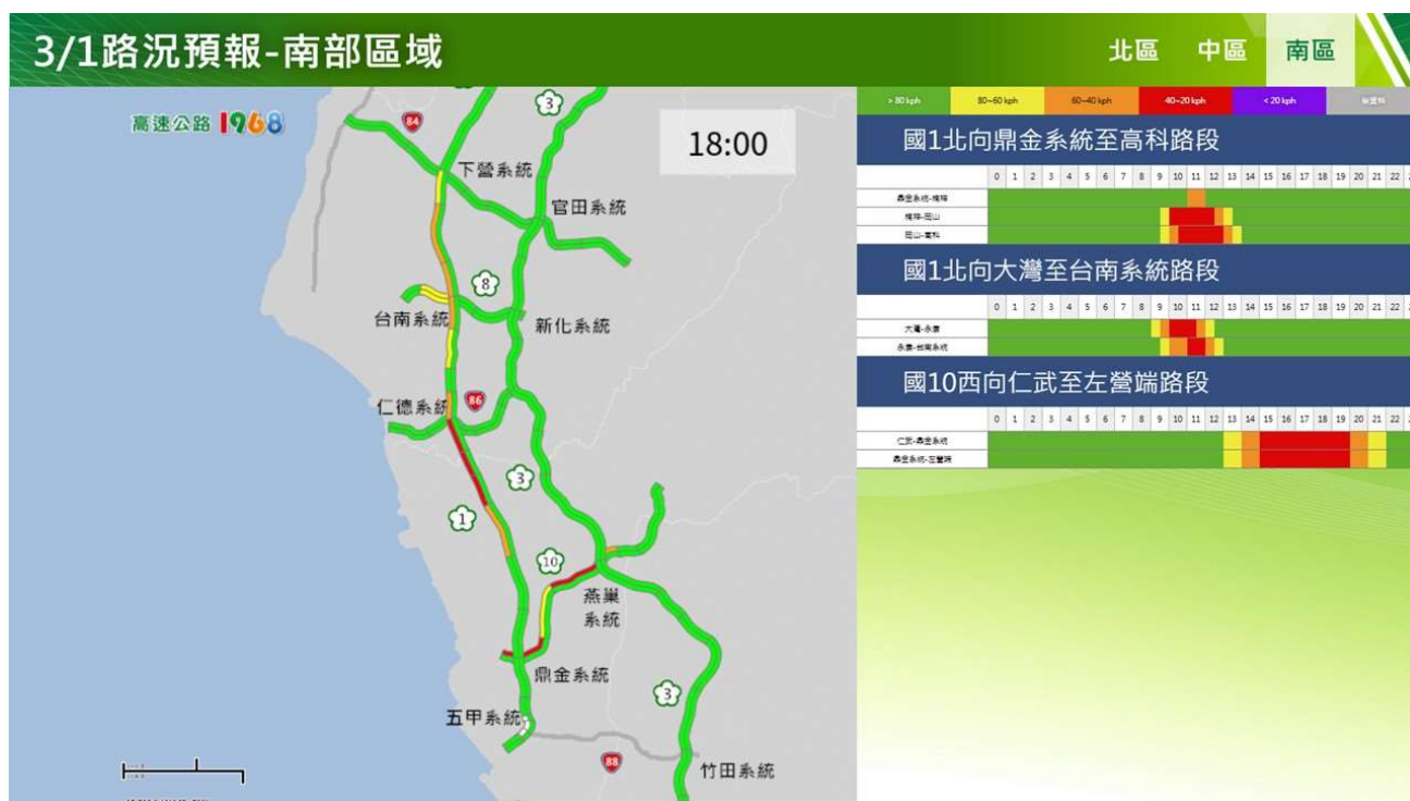
附圖 12：和平紀念日連假第 2 日路況預測(南區北向)