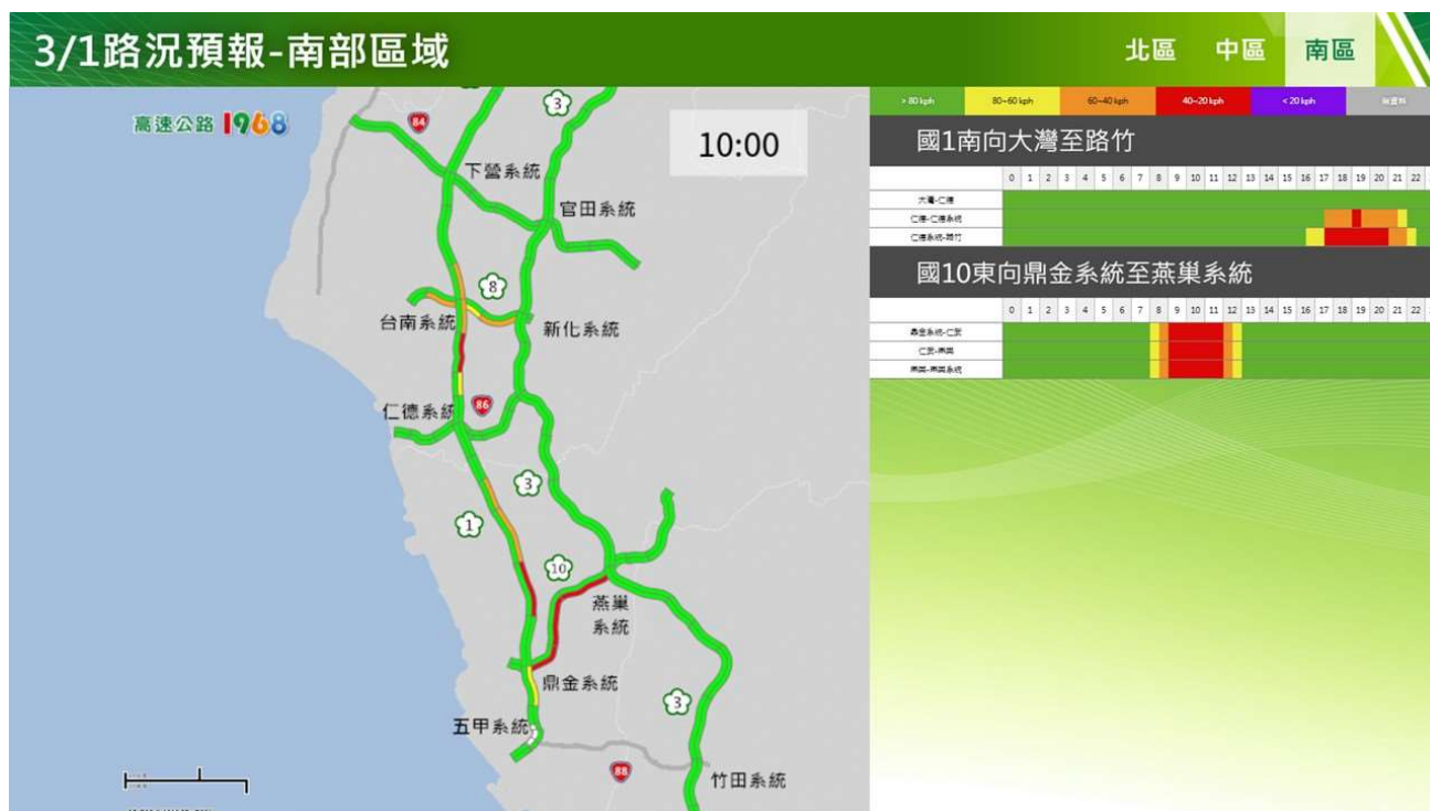
附圖 11：和平紀念日連假第 2 日路況預測(南區南向)