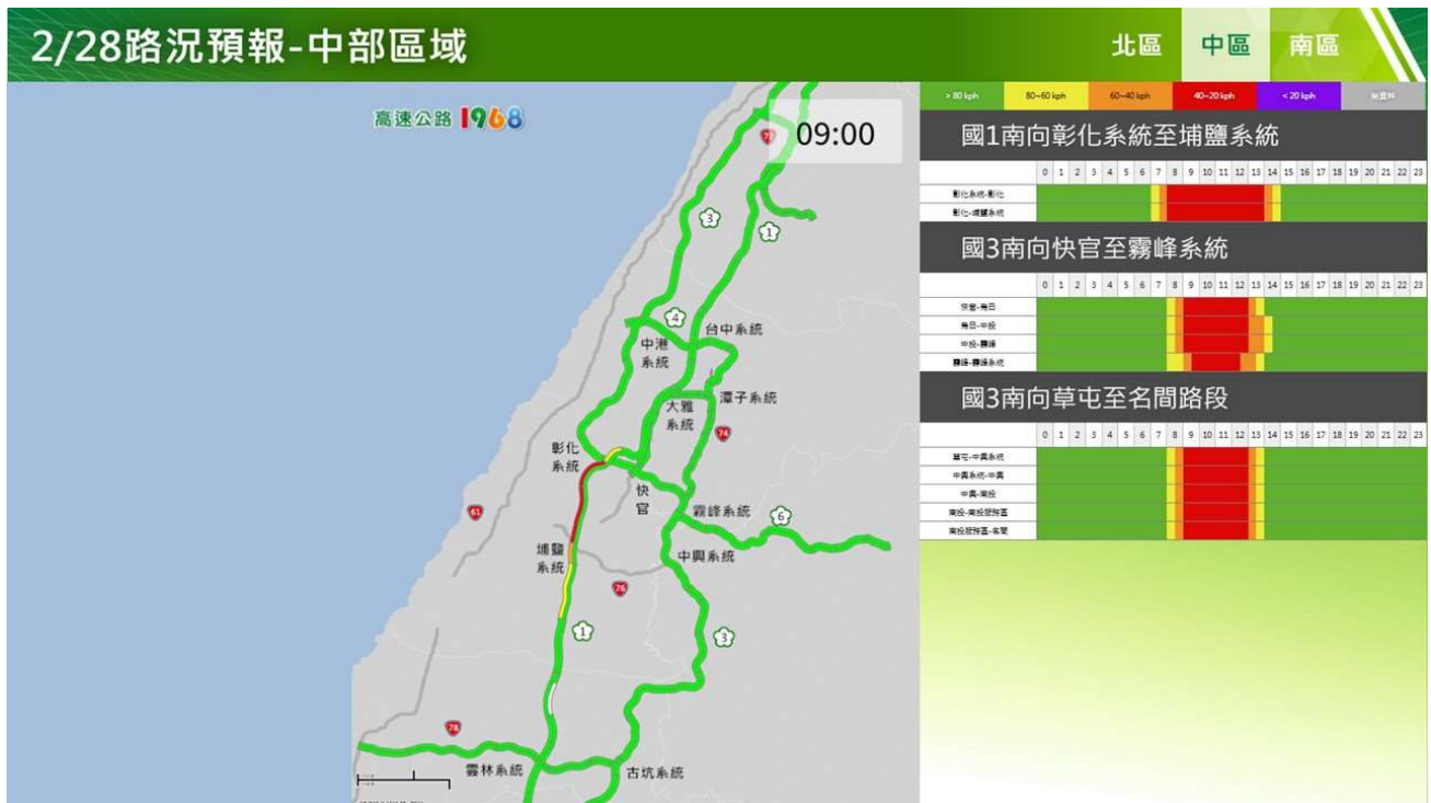
附圖 5：和平紀念日連假首日路況預測(中區)