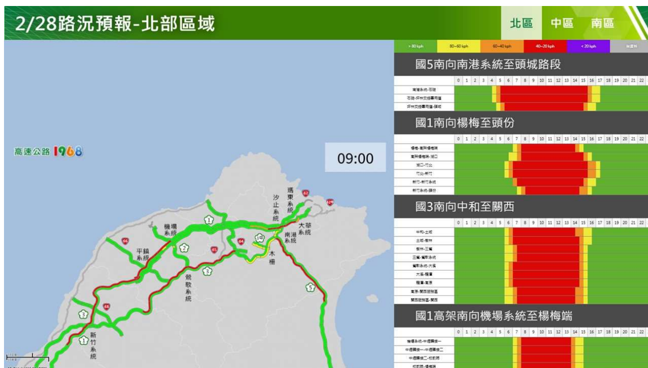
附圖 4：和平紀念日連假首日路況預測(北區)