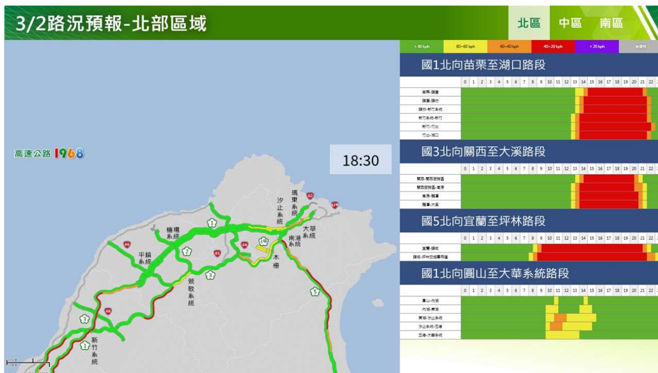
附圖 13：和平紀念日連假收假日路況預測(北區)