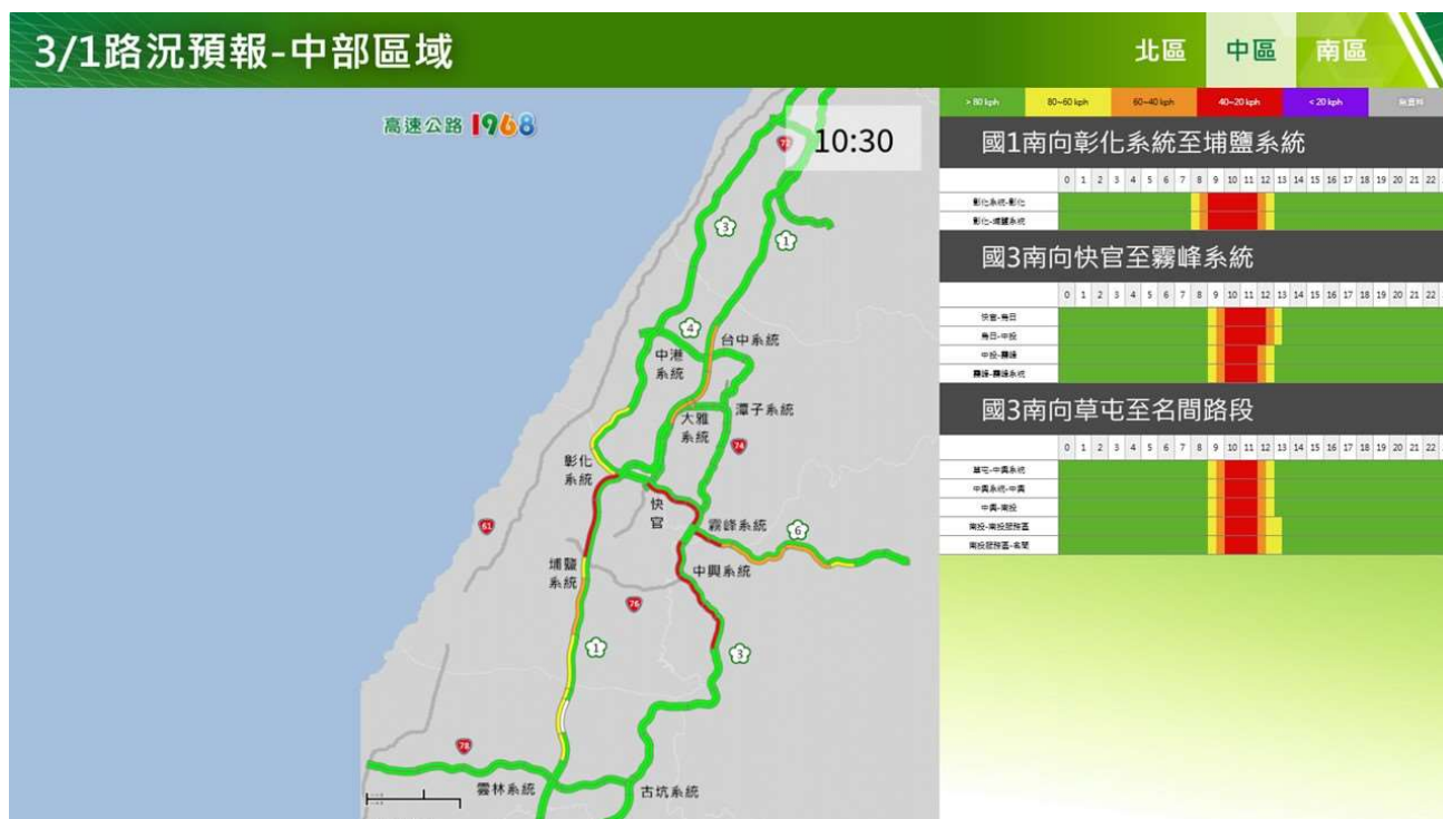
附圖 9：和平紀念日連假第 2 日路況預測(中區南向)