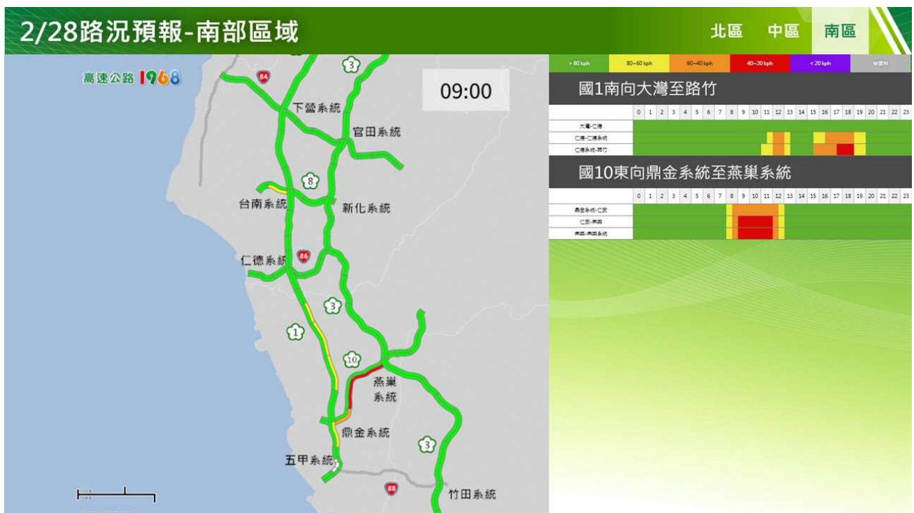
附圖 6：和平紀念日連假首日路況預測(南區)