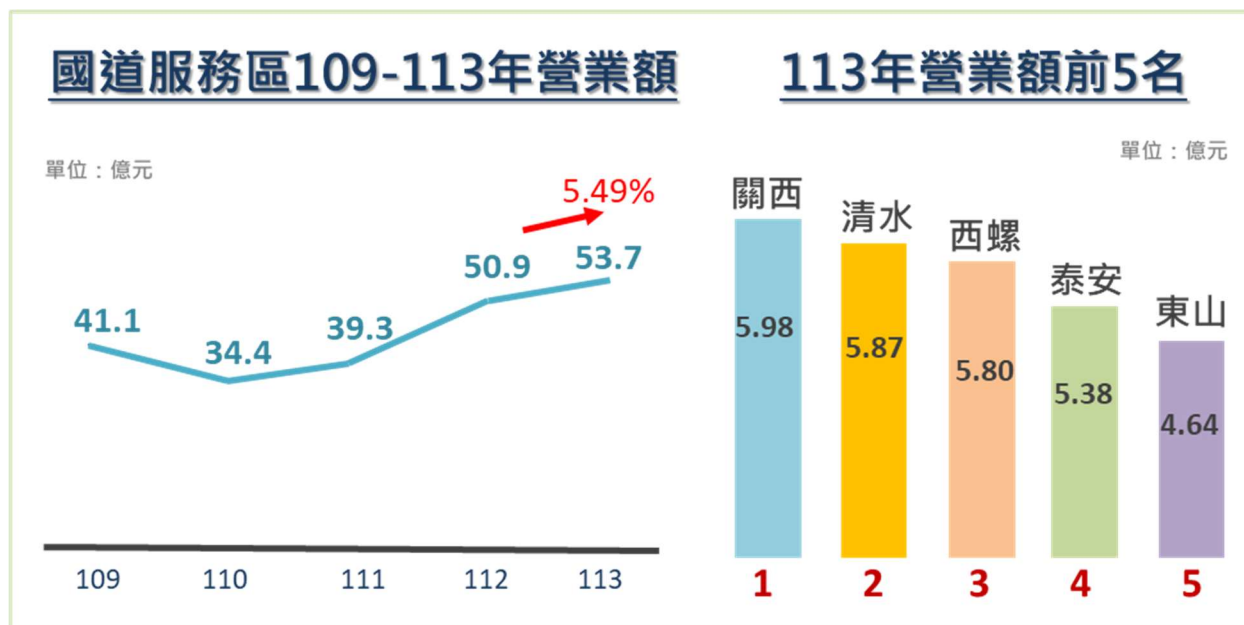
圖 1 國道服務區 113 年營運情形