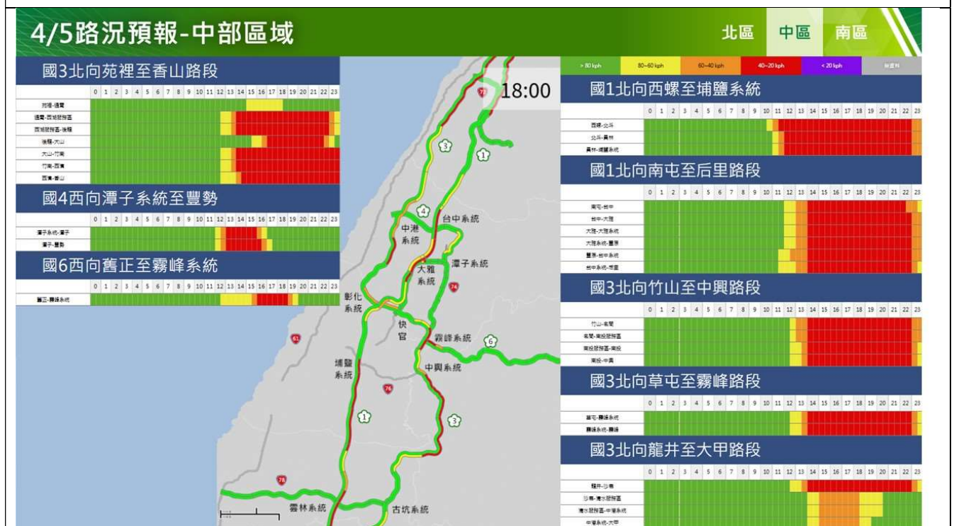
清明節連假第 3 日中部路段路況預報圖