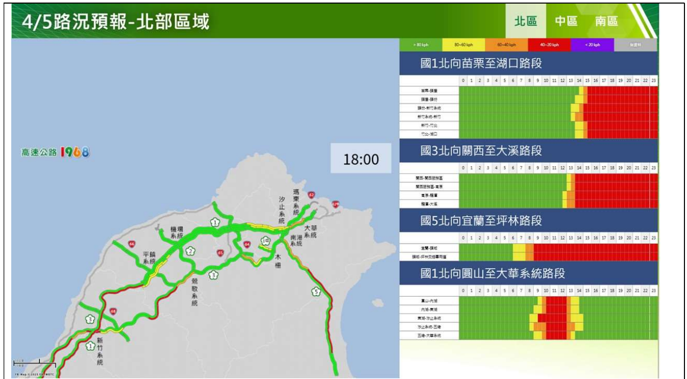
清明節連假第 3 日北部路段路況預報圖