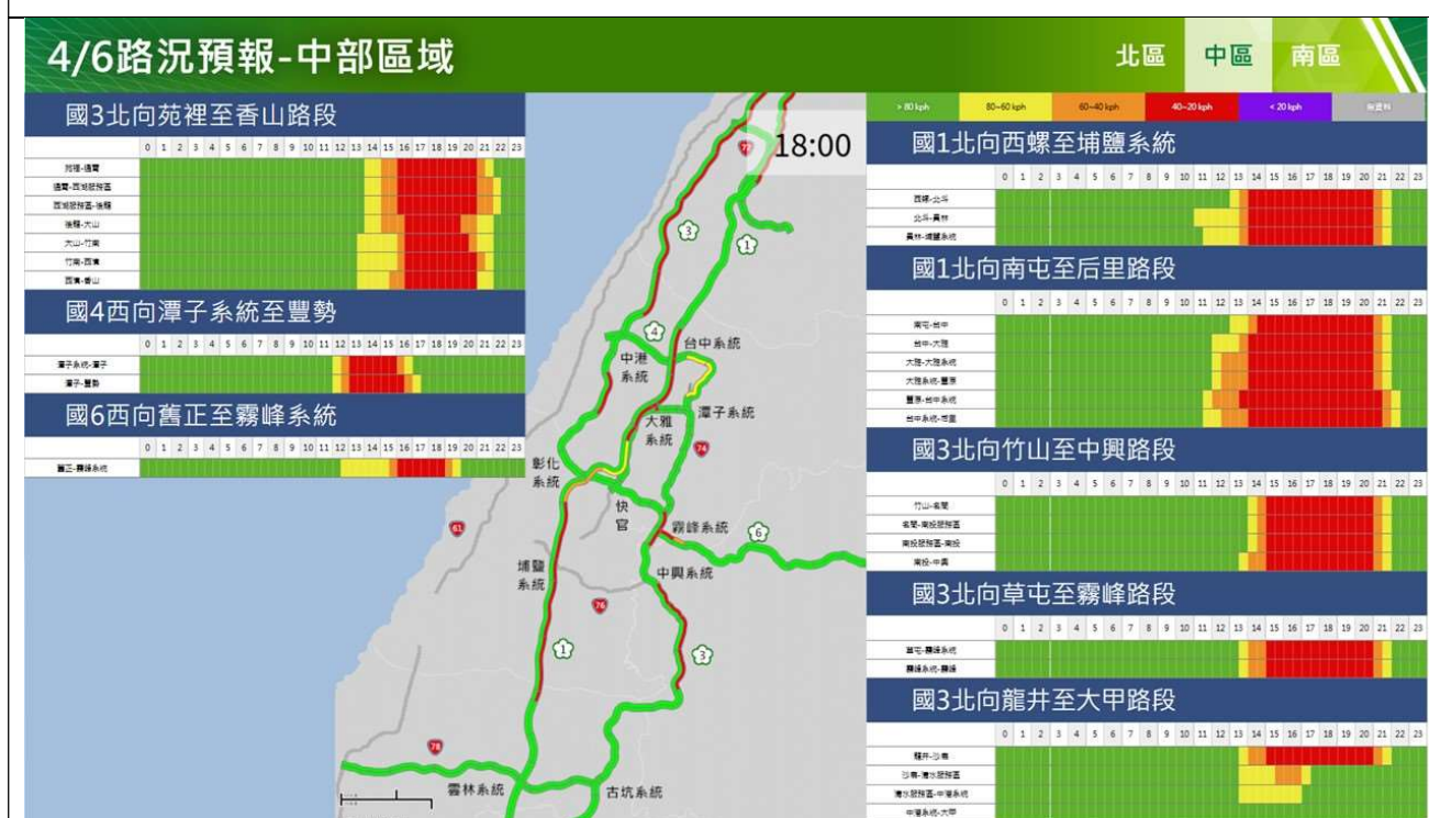
清明節連假收假日中部路段北向路況預報圖