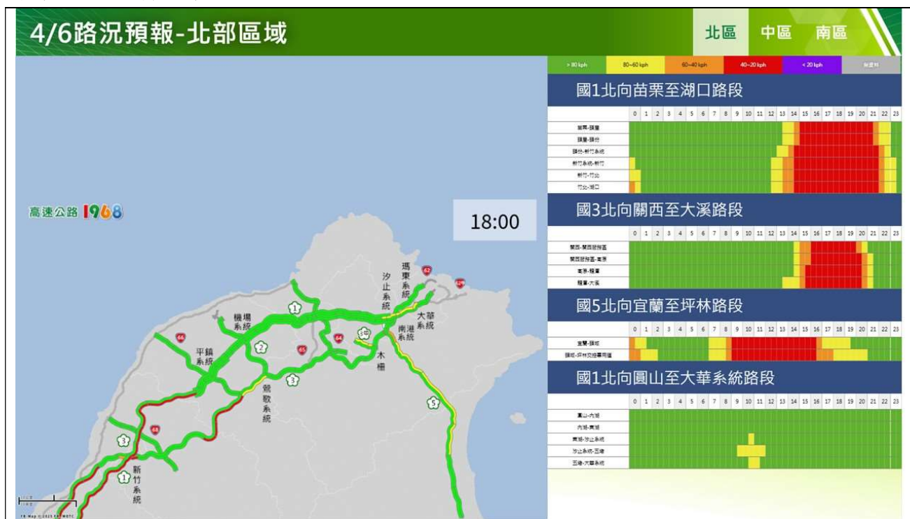
清明節連假收假日北部路段北向路況預報圖