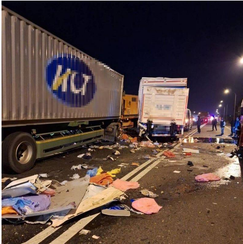
圖 1：1 月 14 日 國 1 南 339k 貨櫃車追撞事故