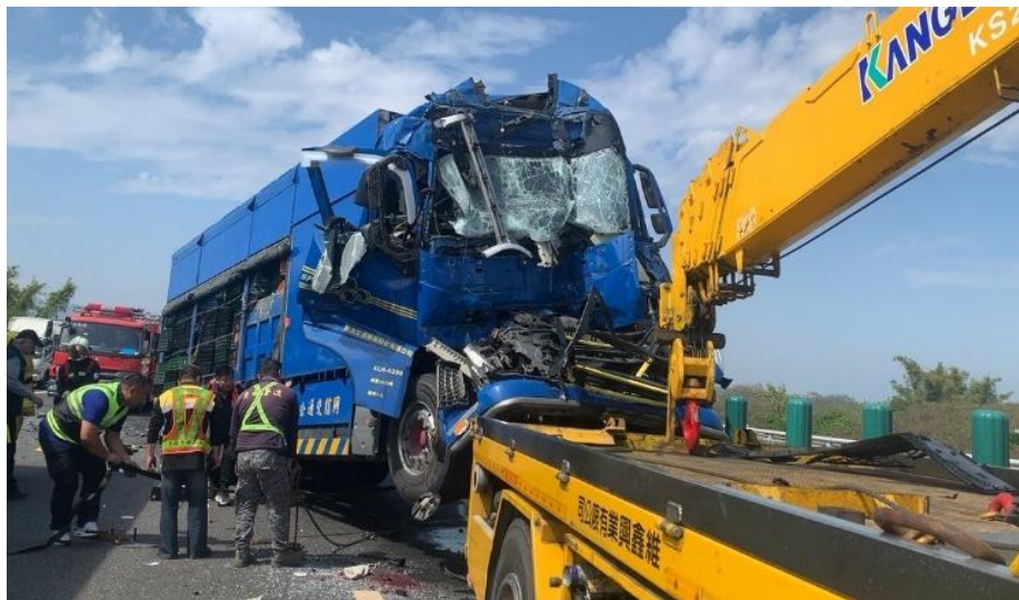
圖 2：2 月 7 日國 3 南 375.6k 4 輛大貨車追撞事故