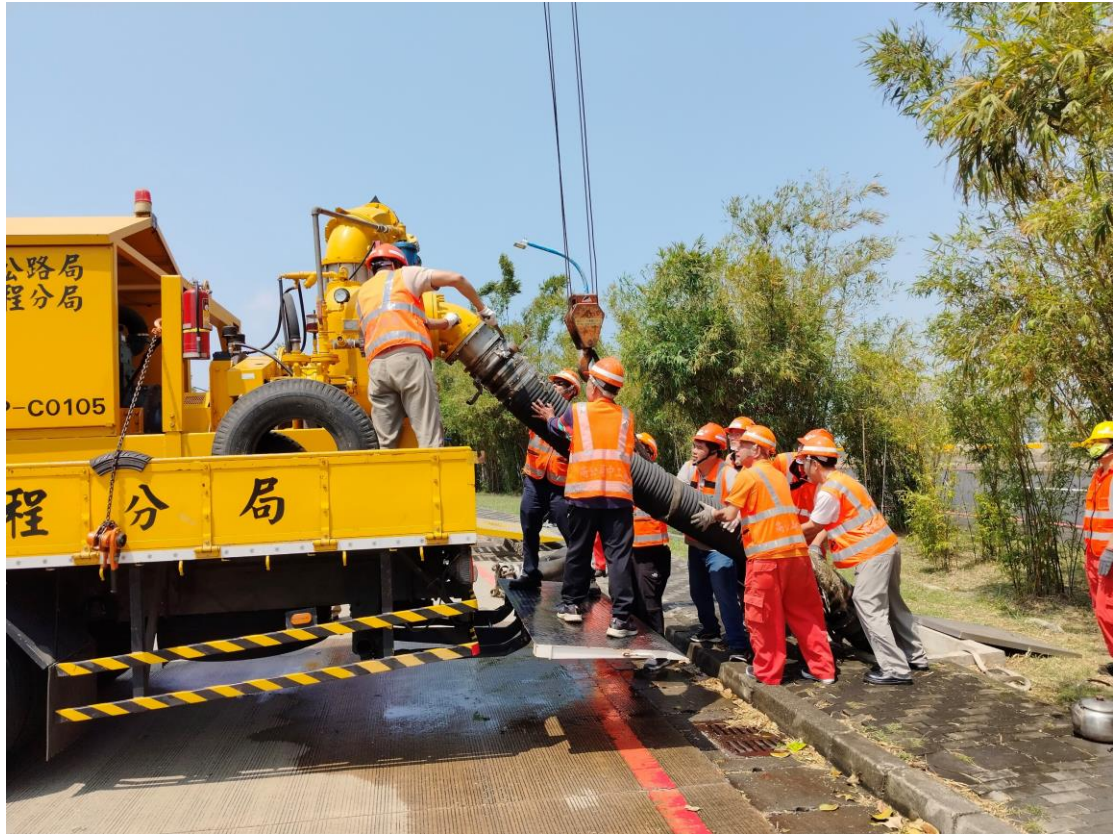
圖 1 大型抽水機操作演練