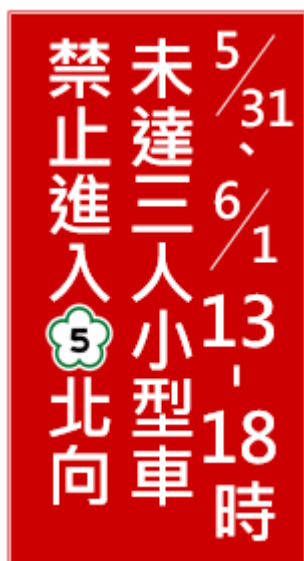
附圖 5-紅底白字文字型禁制性告示牌