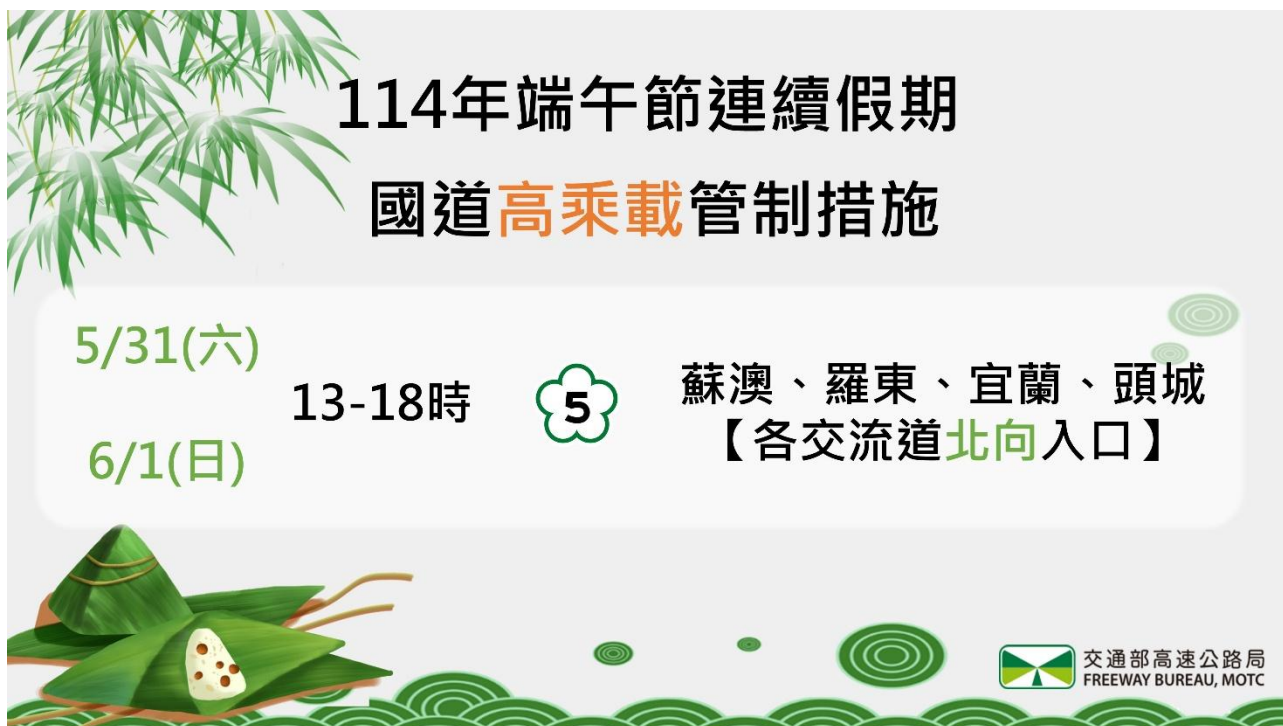
附圖 4-高乘載管制圖形化標誌