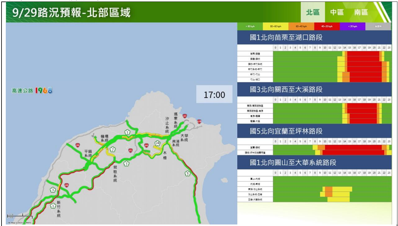
教師節連假收假日北部路段路況預報圖