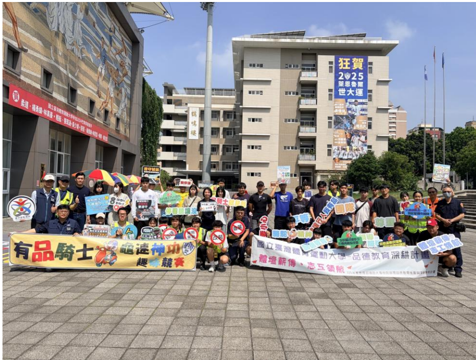
附圖 1 115 年 6 月 2 日國立臺灣體育運動大學交通安全活動聯合 宣導