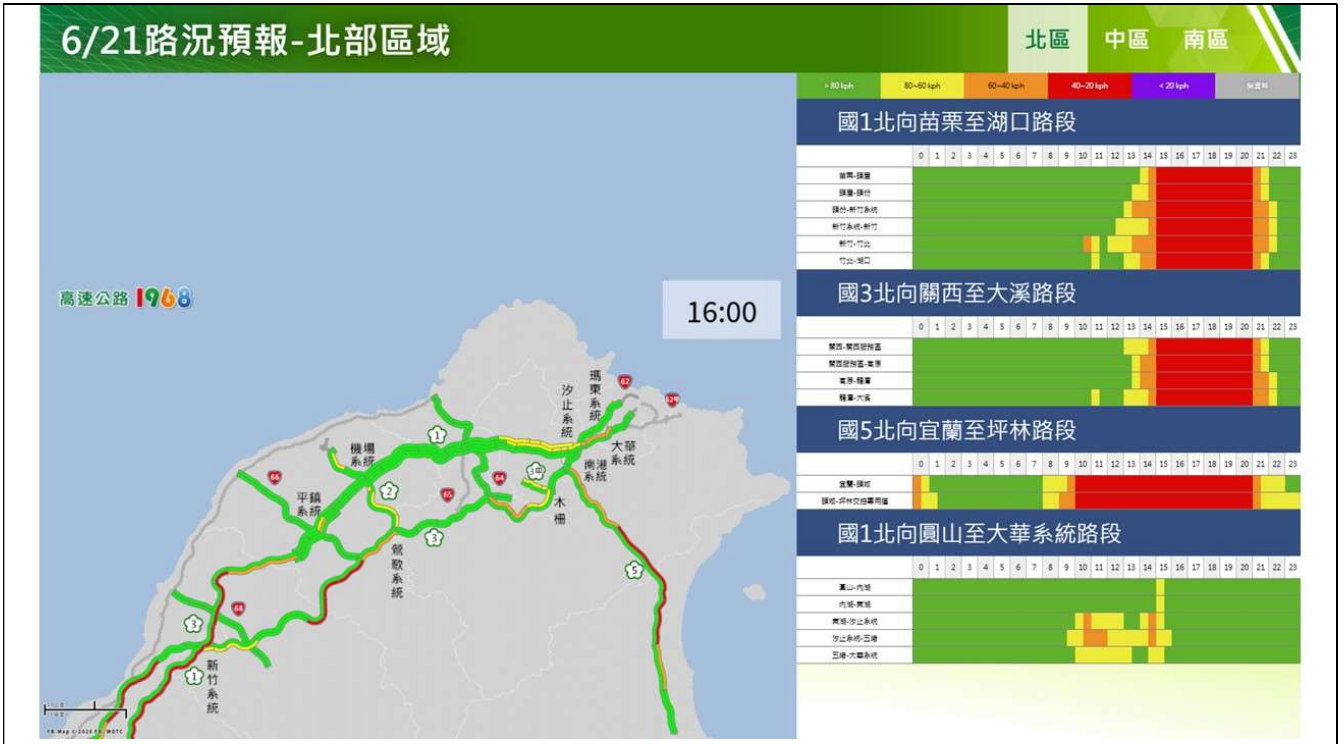
端午節連假收假日北部路段北向路況預報圖