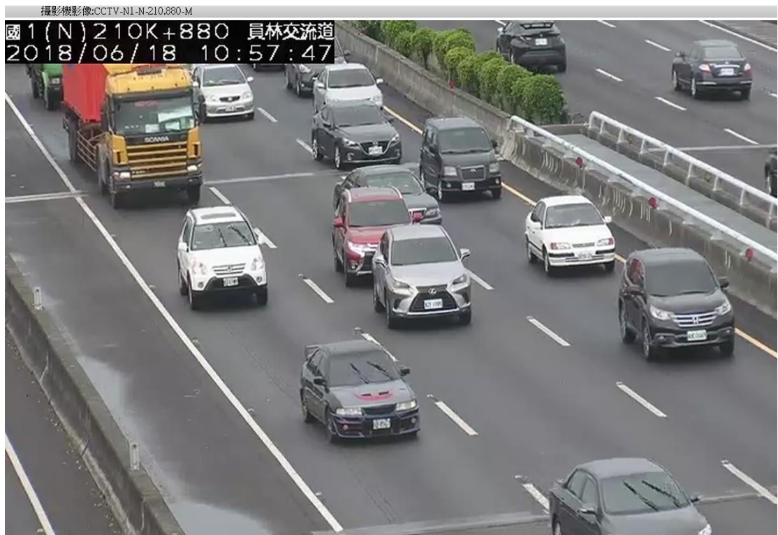
圖 1：國 1 北上 211 公里追撞事故，回堵 2 公里