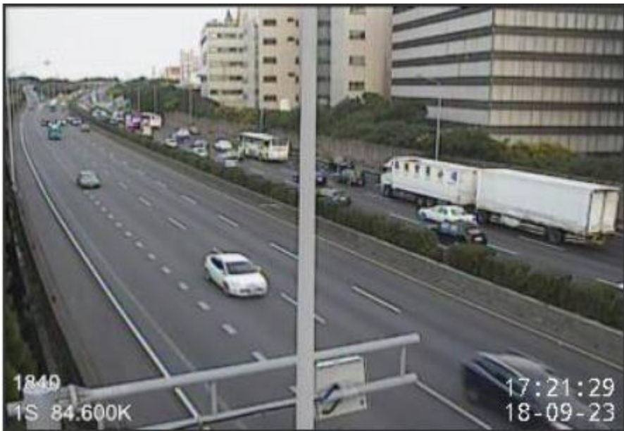
圖 1 17:12 國 1 北向 84.5K 有 3 小自追撞佔用內線事故

CCTV-N3-S-236.966-M 19.65 2018-09-23 16:47:40.61