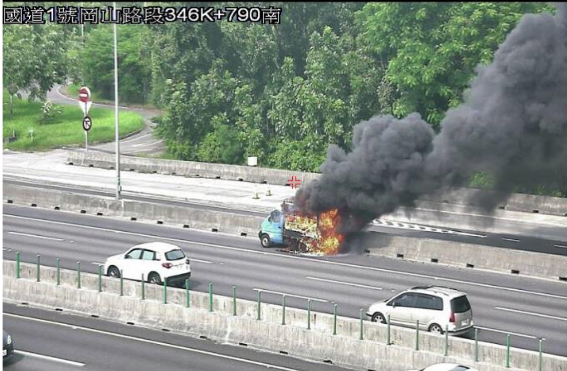
圖 3 14:33 國 1 北上 346.7K 有小貨車起火燃燒事故