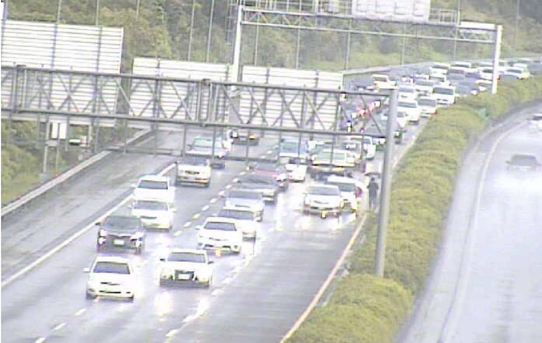
圖 2 16:46 國 3 南向 237K 有 2 小客車追撞事故