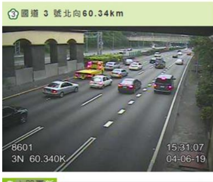
圖 1 國 3 北向 60.3K 內線車道 2 小客車追撞，回堵約 4.5 公里