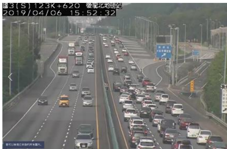
圖 2 國 3 北向 123K 內線車道 2 小客車追撞，回堵約 2 公里