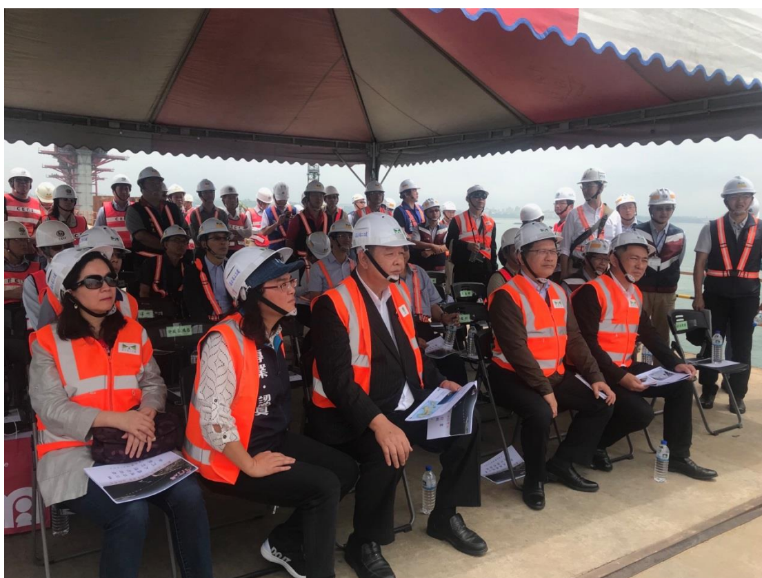
圖 2. 與會長官（由右自左：金門縣長楊鎮浯縣長、交通部長林佳龍部長、陳雪生委員、陳玉珍委員、童惠珍委員）