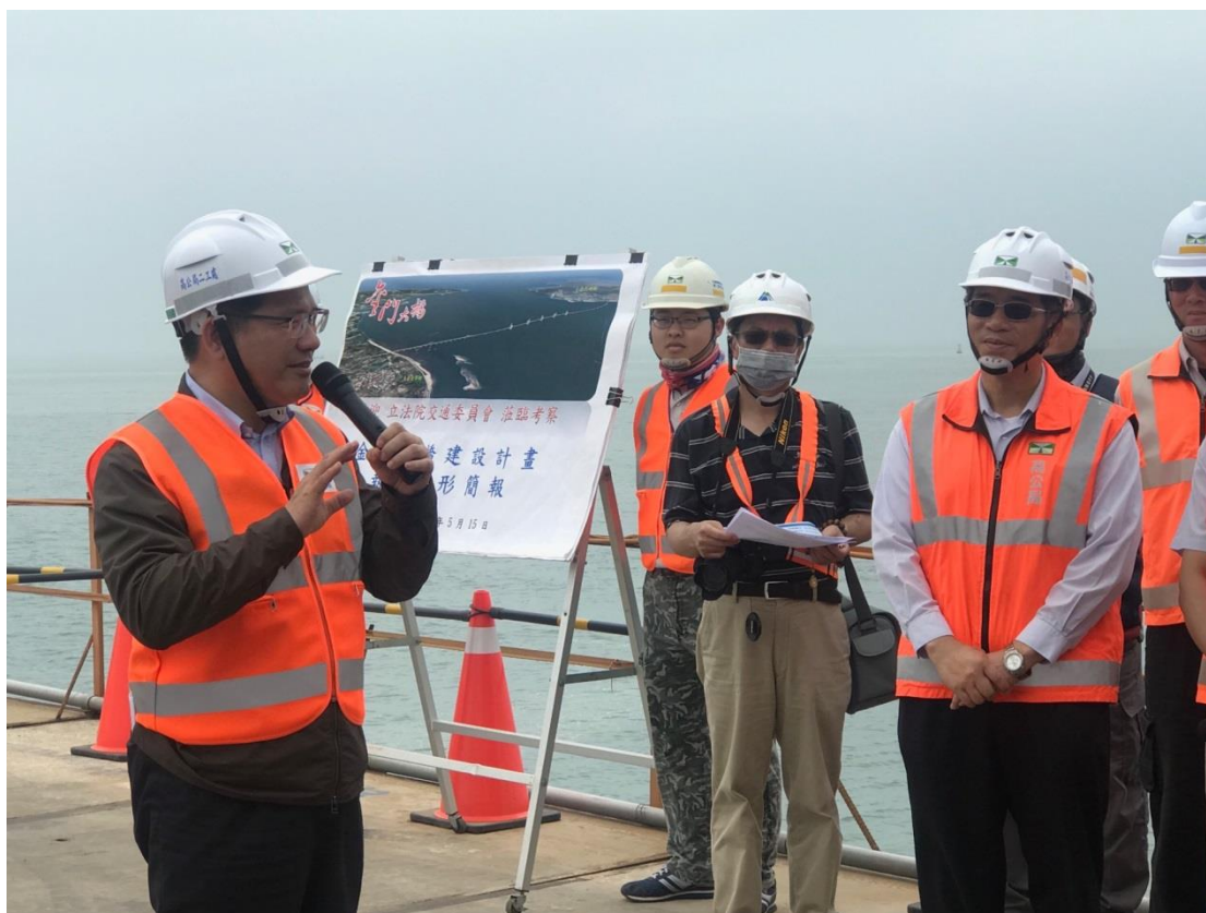
圖 1. 部長致詞