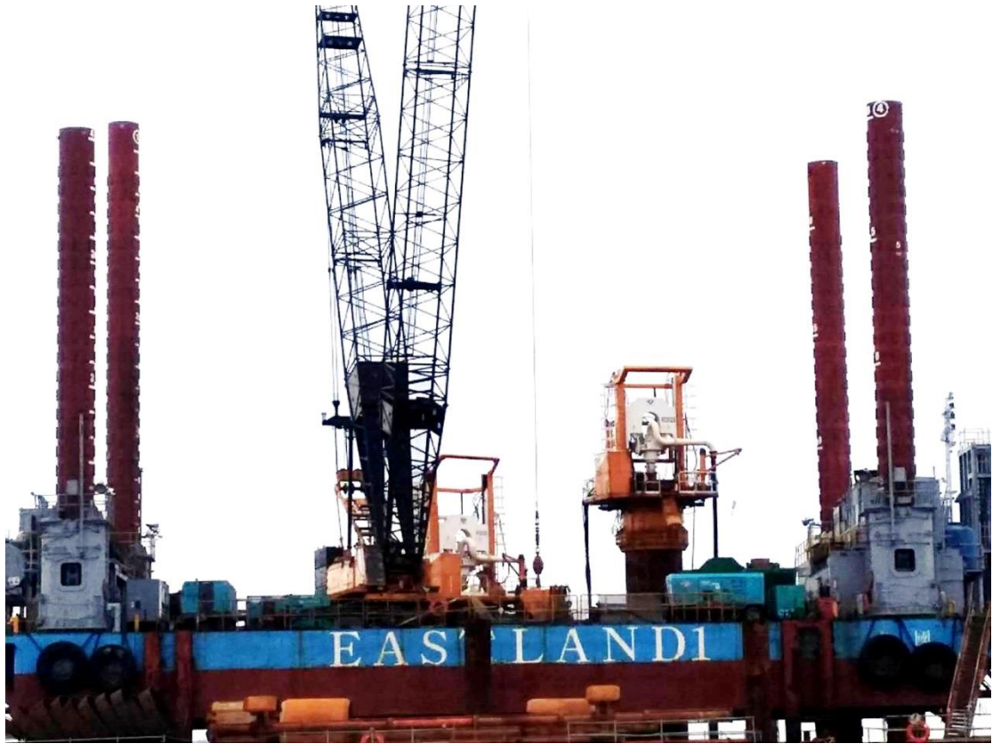
圖 5. P45 基樁鑽掘作業