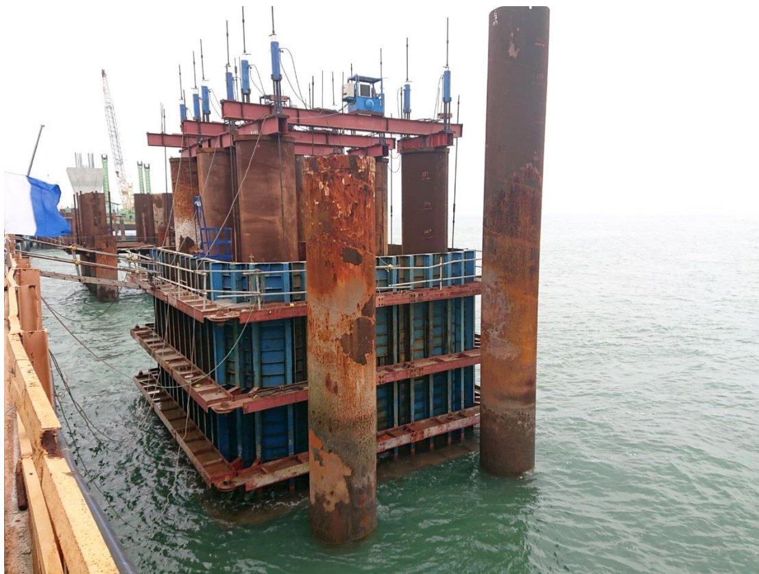
圖 3. P25 鋼箱圍堰下放