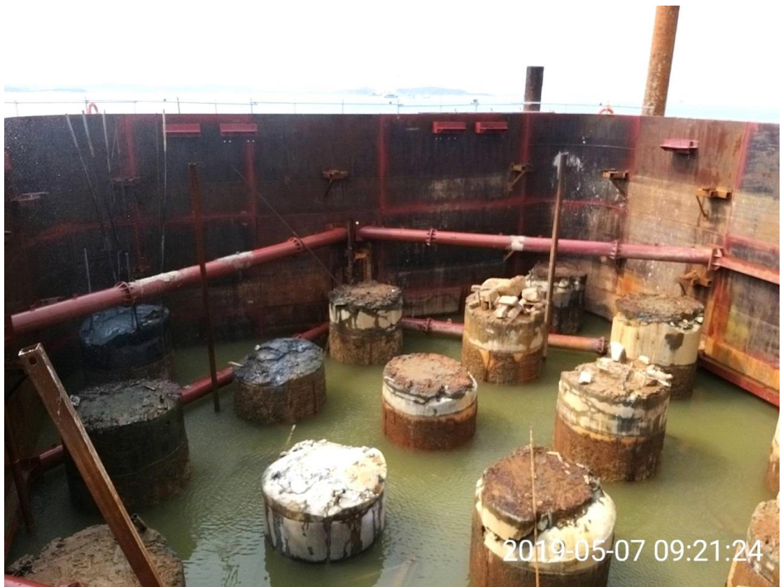
圖 6. P48 樁帽圍堰抽水進行樁頭處理