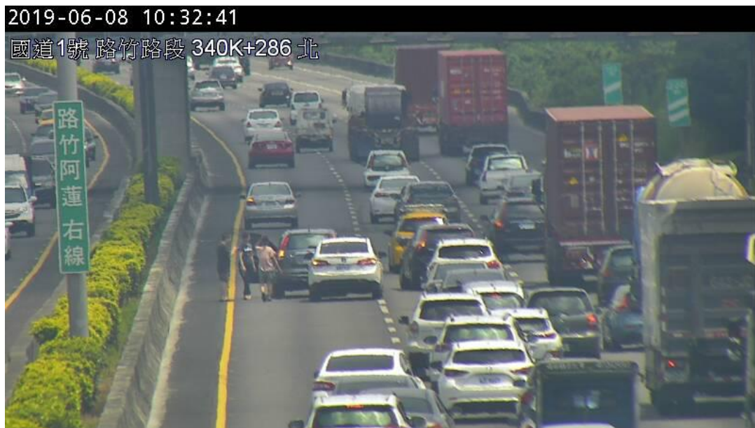
圖 1 國 1 北向 339.2 公里發生 2 小客車追撞事故，占用內側車道，造成回堵約 3 公里