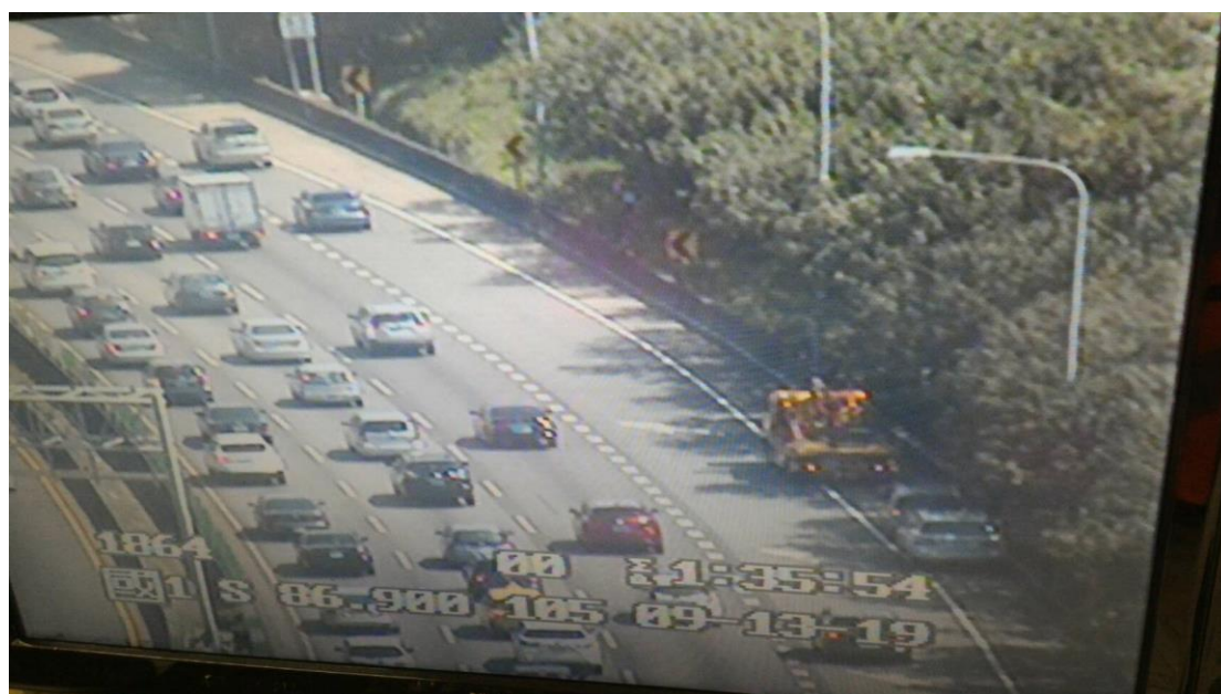
圖 2 國 1 南向 87.2K 路肩 2 小車追撞事故回堵 4K