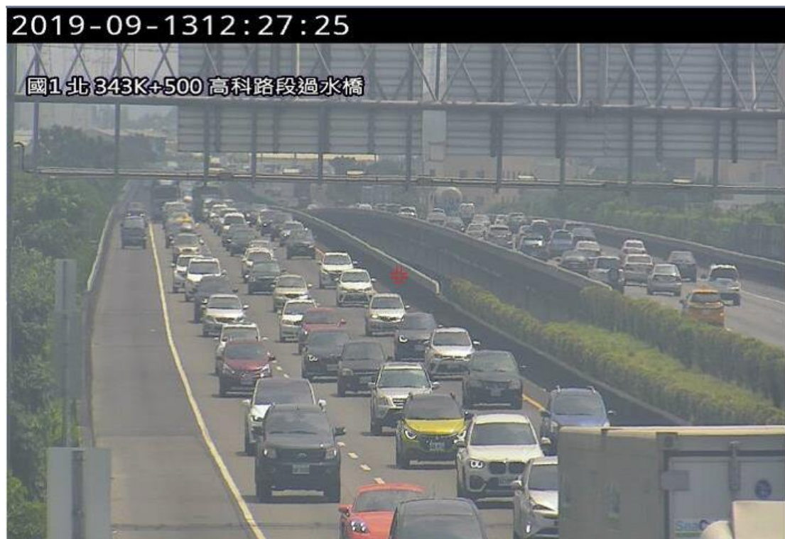
圖 1 國 1 北上 343.8K 3 小客車追撞回堵約 6k