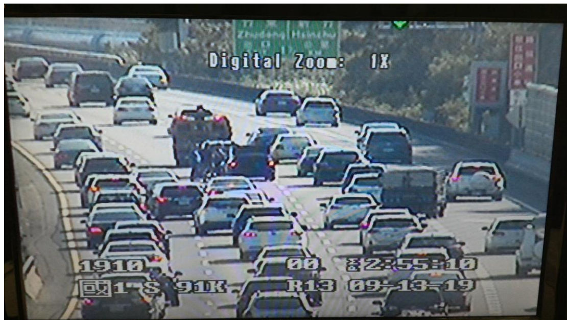
圖3 國1南向91.4K中線2小車追撞事故回堵7K