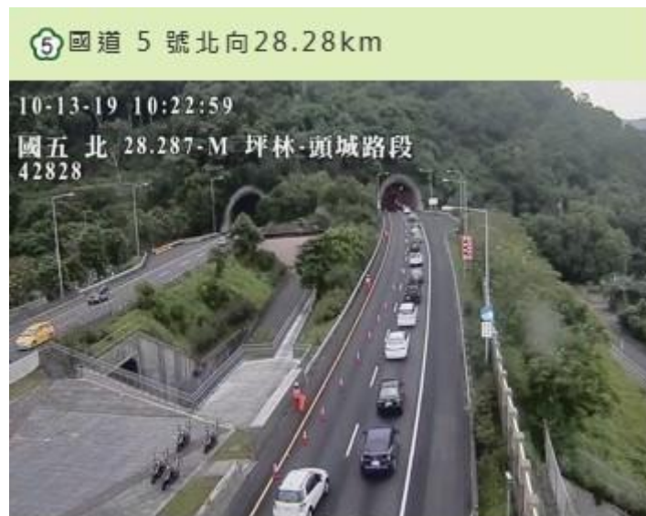
圖 1. 國 5 雪隧北向 10:07 於 23.3K 發生故障車占用內車道