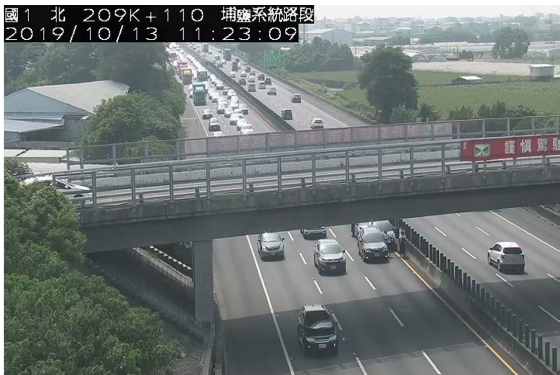
圖 2. 10/13, 11:22 國 1 北向 209.5k 發生小客車追撞事故占內車道回堵 2 公里