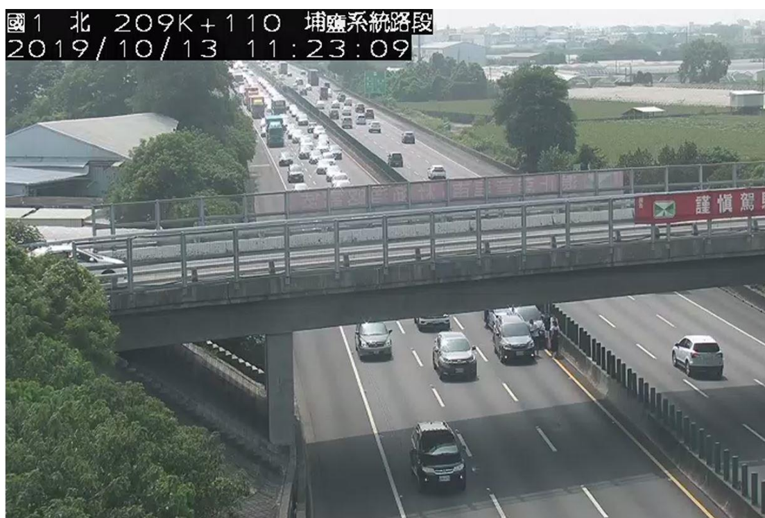
圖 2.10/13,11:22 國 1 北向 209.5k 發生小客車追撞事故占內車道回堵 2 公里