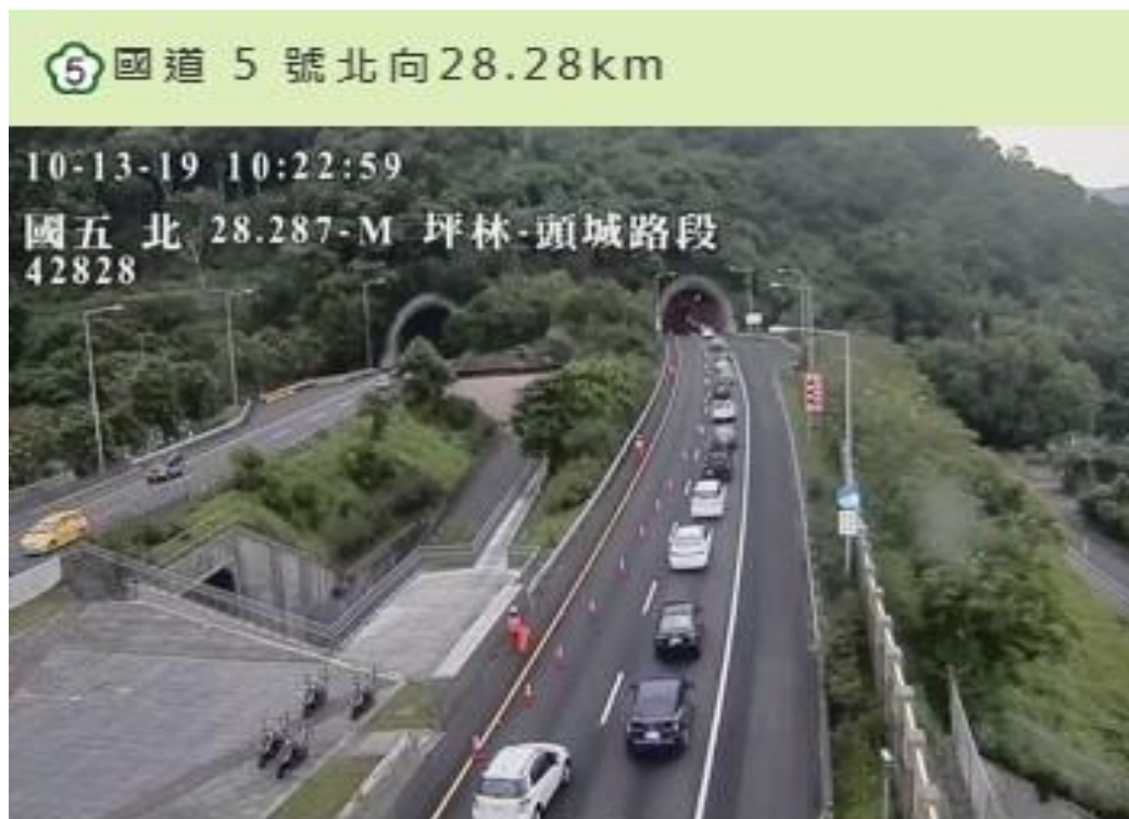
圖 1.國 5 雪隧北向 10:07 於 23.3K 發生故障車占用內車道