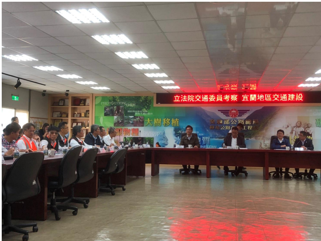
圖 1. 立法院交通委員會考察宜蘭地區交通建設