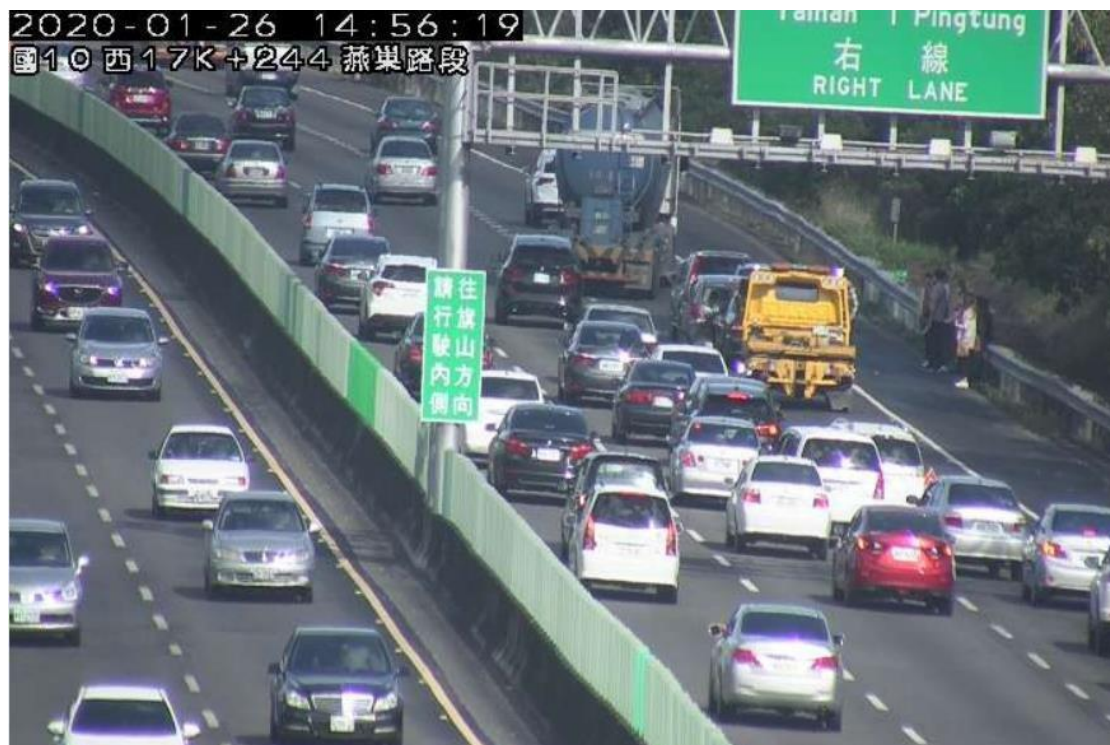
14 時 56 分國 10 東向 17.7k 事故