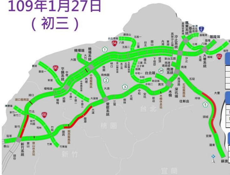
國一北向新竹系統至湖口路段