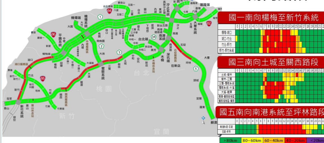
和平紀念日連假首日北部路段南向路況預報圖