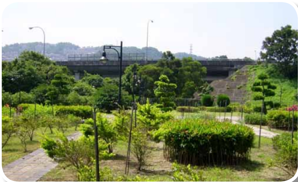
中和市公所認養國道 3 號南下（36k+150）旁土地路美化

四、開放國道高速公路交流道、邊坡及高架橋下景觀認養，鼓勵公私機構、法人或非法人團體參與高速公路沿線景觀維護認養工作，不僅可改善國道景觀，並有助於增加公共空間、提升鄰近社區生活環境品質；目前辦理認養有中和市公所等 39 個單位。