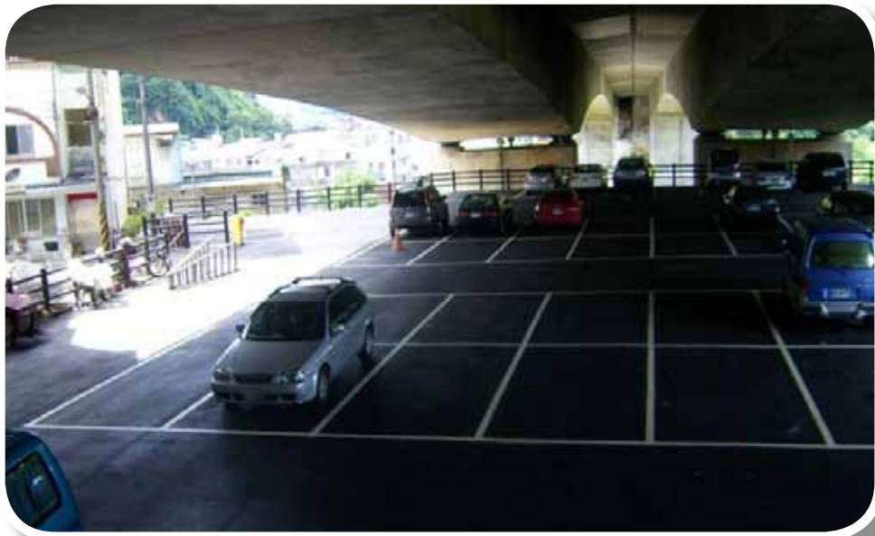
汐止市公所租用國道 3 號（9k+760~9k+830）高架橋南下土地作為停車場使用

四、開放國道高速公路交流道、邊坡及高架橋下景觀認養，鼓勵公私機構、法人或非法人團體參與高速公路沿線景觀維護認養工作，不僅可改善國道景觀，並有助於增加公共空間、提升鄰近社區生活環境品質；目前辦理認養有中和市公所等 39 個單位。